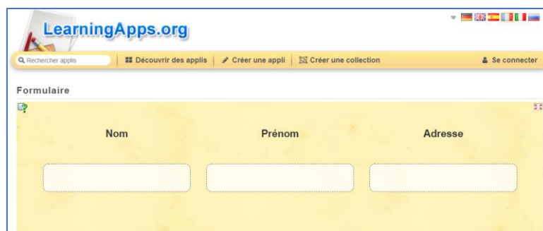
Figure 2 : Capture d'écran activité Learningapps

À travers des activités routinières, il est possible de favoriser la « mémoire de l'oubli » (Souchier, 2012 : 4) afin d'éviter une « surcharge cognitive » et de rendre les gestes de pointage et de clic naturels, sans avoir besoin de réfléchir au geste à exécuter. Pour réaliser ce type d'activités itératives, les formateurs en alphabétisation ou les accompagnants d'ateliers numériques pourraient proposer des exercices à réaliser à chaque début de séance de manière systématique, soit sur traitement de texte (par exemple en proposant de cliquer dans une zone de texte pour écrire la date du jour) ou en concevant spécifiquement des exercices, par exemple, via le site Learningapps, développé par la Haute École Pédagogique de Berne, qui permet la création d'activités interactives simples pour apprendre à manipuler la souris et le clic.