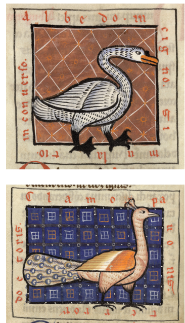
9, 9bis & 8ter - Hugues de Fouilloy, Aviariium , miniatures du cygne et du paon (Saint-Omer, BA, ms. 93, f. 34v).

Les miniatures de la seconde partie de l' Aviariium (fig. 8 et 9) sont caractérisées par « des éléments concrets et descriptifs, aisément mémorisables en raison de leur absence de subtilité » 60 . La couleur caractérise douze oiseaux que l'on peut organiser en trois groupes :