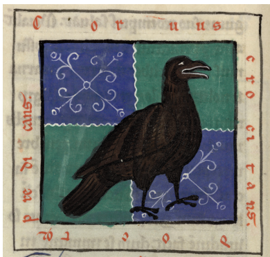
8 & 8bis - Hugues de Fouilloy, Aviariium , miniature du corbeau (Saint-Omer, BA, ms. 93, f. 22).