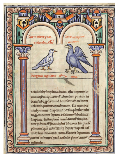
1 - Hugues de Fouillois, Aviarium , miniature de la dédicace (Saint-Omer, BA, ms. 93, f. 13).

La situation du diagramme de la colombe (fig. 2) le développement de l' Aviarium en fait une Bildensatz , selon la définition de M. Evans, tout au début d'une œuvre, l'auteur en appelle à la mémoire de son spectateur, lecteur ou auditeur fictif, en lui fournissant un résumé des principales matières