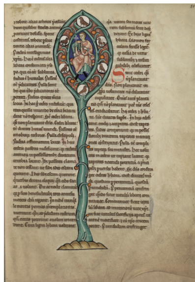
7 - Hugues de Fouilly, Aviarius , miniature du cèdre et des passereaux (Saint-Omer, BA, ms. 93, f. 20).

du IV e siècle, « peindre » la croix [...] Ce motif à la fois visuel et rhétorique fonctionne comme une allegoria , un ornement qui met en marche la pensée méditative » 51 .