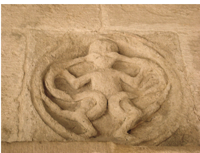
13 - Saint-Donat-sur-l'Herbasse, Collégiale Saint-Pierre-et-Saint-Paul, médaillon des écoinçons de la galerie du cloître (homme attaqué par des serpents – la luxure ou le mensonge ?).

car cela permettait de ne recevoir que des adultes déjà éduqués et formés 84 . Seulement, et l' Aviarium en témoigne, il arrivait aussi que la vocation religieuse apparaisse chez des adultes ayant d'abord suivi une carrière autre que celle de clerc. Par conséquent, il devenait nécessaire de compenser leur absence de formation cléricale et religieuse en leur dispensant un enseignement adapté à leur niveau d'instruction.