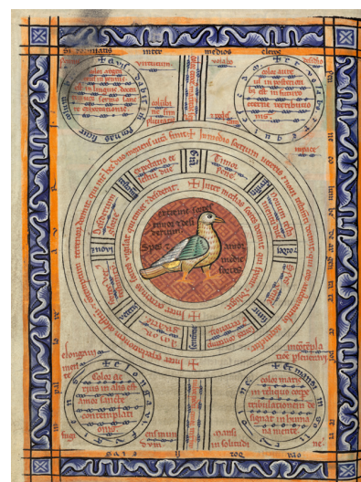
2 - Hugues de Fouillois, Aviarium , diagramme de la colombe (Saint-Omer, BA, ms. 93, f. 13v).