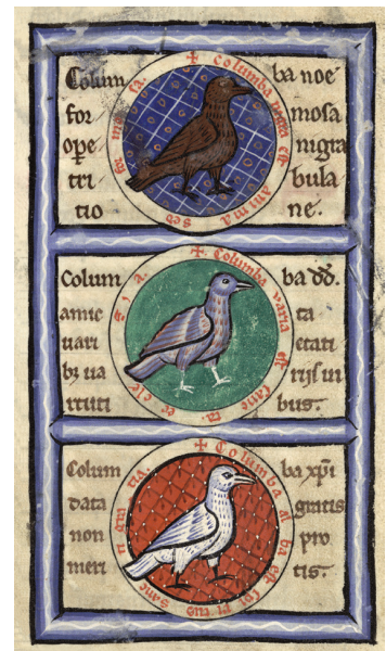
3 & 3bis - Hugues de Fouilly, Aviarium , diagramme des trois colombes (Saint-Omer, BA, ms. 93, f. 14).