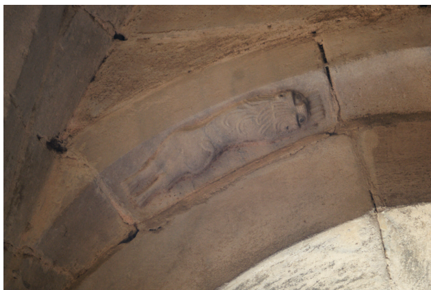
14 - Elne, cathédrale Sainte-Eulalie et Sainte-Julie, lion couché le long d'une voûture d'une arcade de la galerie du cloître.