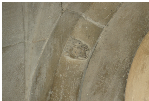
15 - Elne, cathédrale Sainte-Eulalie et Sainte-Julie, lion couché le long d'une voûture d'une arcade de la galerie du cloître.

le-Désert 86 . Toutefois, la majorité des exemples conservés provient d'édifices canoniaux, recoupant en cela l'origine des témoignages sur l' hora locutionis qui émanent de communautés canoniales. Or, les chanoines avaient, entre autres fonctions d'assumer celle de l'enseignement. Le point commun de ces séries de figures, souvent des médaillons, est qu'elles présentent des séquences qui n'ont ni d'ordre ni de signification évidente. C'est pourquoi elles ont été classées dans la catégorie des éléments purement ornementaux. Pourtant, leur emplacement et leurs caractéristiques iconographiques en font, a priori d'excellents supports de l'art de mémoire. L'association de chaque médaillon à une arcature renvoie à celle entre lieu topique et image mémorielle (Chaque médaillon étant associé à une arcature, l'association entre un lieu topique et une image mémorielle). Il revient au novice qui, à force de déambuler dans le cloître, connaît par cœur leur séquence d'y associer les enseignements de ses maîtres.