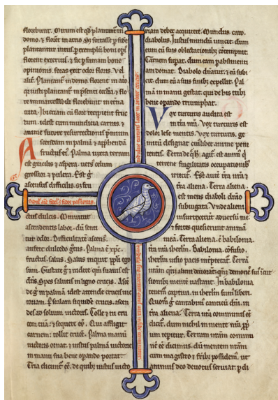
6 - Hugues de Fouilly, Aviarius , diagramme de la tourterelle (Saint-Omer, BA, ms. 93, f. 19).