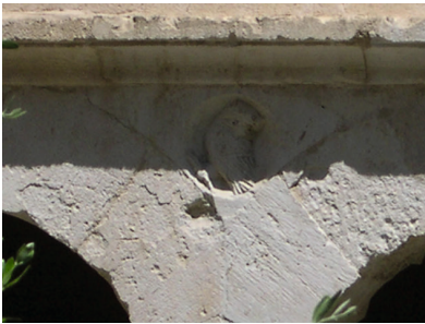
11 - Aix-En-Provence, cathédrale Saint-Sauveur, médaillon des écoinçons de la galerie du cloître.