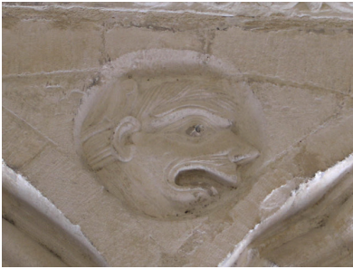
10 - Aix-En-Provence, cathédrale Saint-Sauveur, médaillon des écoinçons de la galerie du cloître.