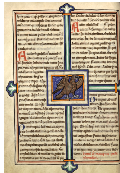
4 - Hugues de Fouilly, Aviarium , diagramme de l'atour (Saint-Omer, BA, ms. 93, f. 16v.).