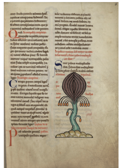
5 - Hugues de Fouilly, Aviarium , miniature du palmier (Saint-Omer, BA, ms. 93, f. 18).

à venir, lesquelles sont présentées comme une succession d'images à support variable : peinture, sculpture, broderie ou mosaïque » 49 . La roue qu'il contient contribue en fait un excellent support de mémorisation, car « la roue est une image non seulement agréable et fermée sur elle-même, facile à visualiser, mais elle a aussi l'avantage de pouvoir être subdivisée de plusieurs façons : hiérarchiquement, par une série de cercles allant du centre à la circonférence, radialement par une série de compartiments divisés par des rayons, et linéairement autour de la circonférence » 50 .