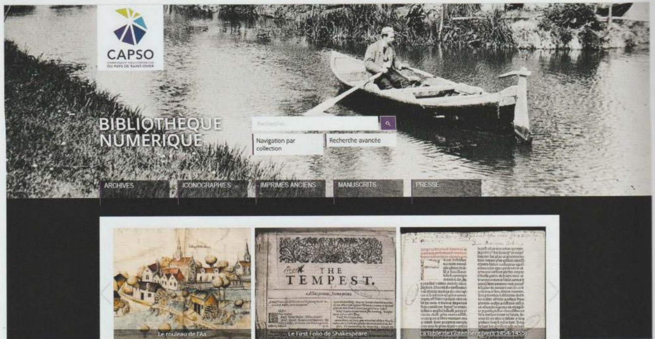
Fig. 8. Page d'accueil de la bibliothèque numérique de la communauté d'agglomération du pays de Saint-Omer © BAPSO.

Les expositions s'efforcent de répondre à des problématiques construites selon trois approches différentes : le livre comme source documentaire pour éclairer un thème (expositions thématiques à présentation diachronique 25 ) ; le livre comme témoin de l'évolution de la pensée sur un sujet précis (expositions chronologiques 26 ) ; le livre comme objet archéologique (expositions codicologiques 27 ). Chaque fois, un petit catalogue ou une plaquette d'accompagnement sont réalisés ainsi qu'un livret jeunesse. Depuis l'été 2013, quatorze expositions ont été montées, dont certaines avec un commissariat scientifique extérieur. Elles accueillent entre 1 500 et 3 000 visiteurs par trimestre.