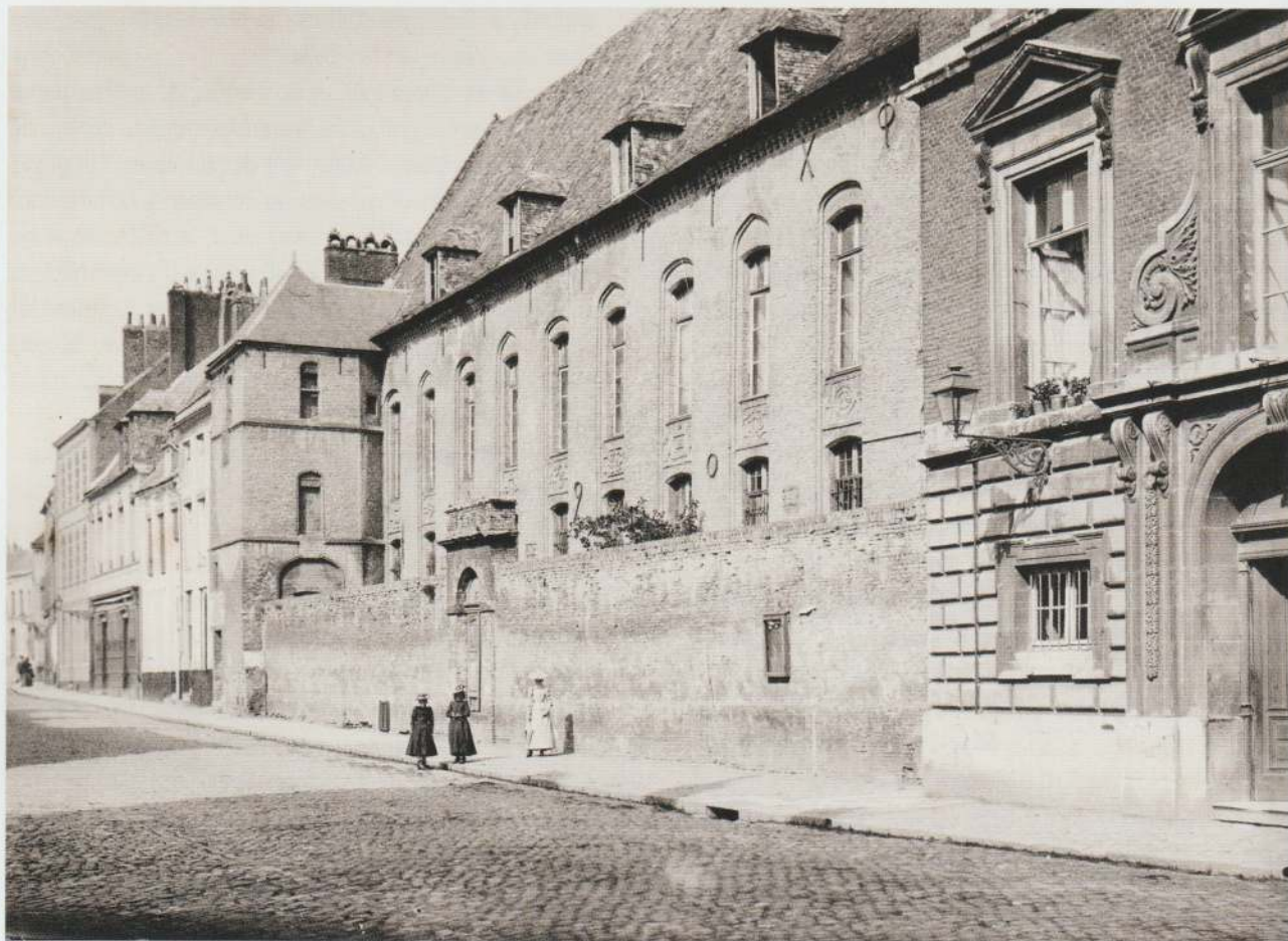
Fig. 2. Saint-Omer, ancien collège des jésuites wallons, façade rue Gambetta, avant