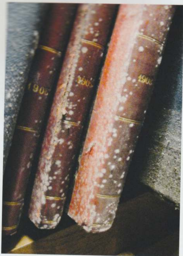
Fig. 5. Saint-Omer, bibliothèque municipale : infestations de moisissures, 2011-2012.

connuent nos prédécesseurs lors des différents déménagements des collections.