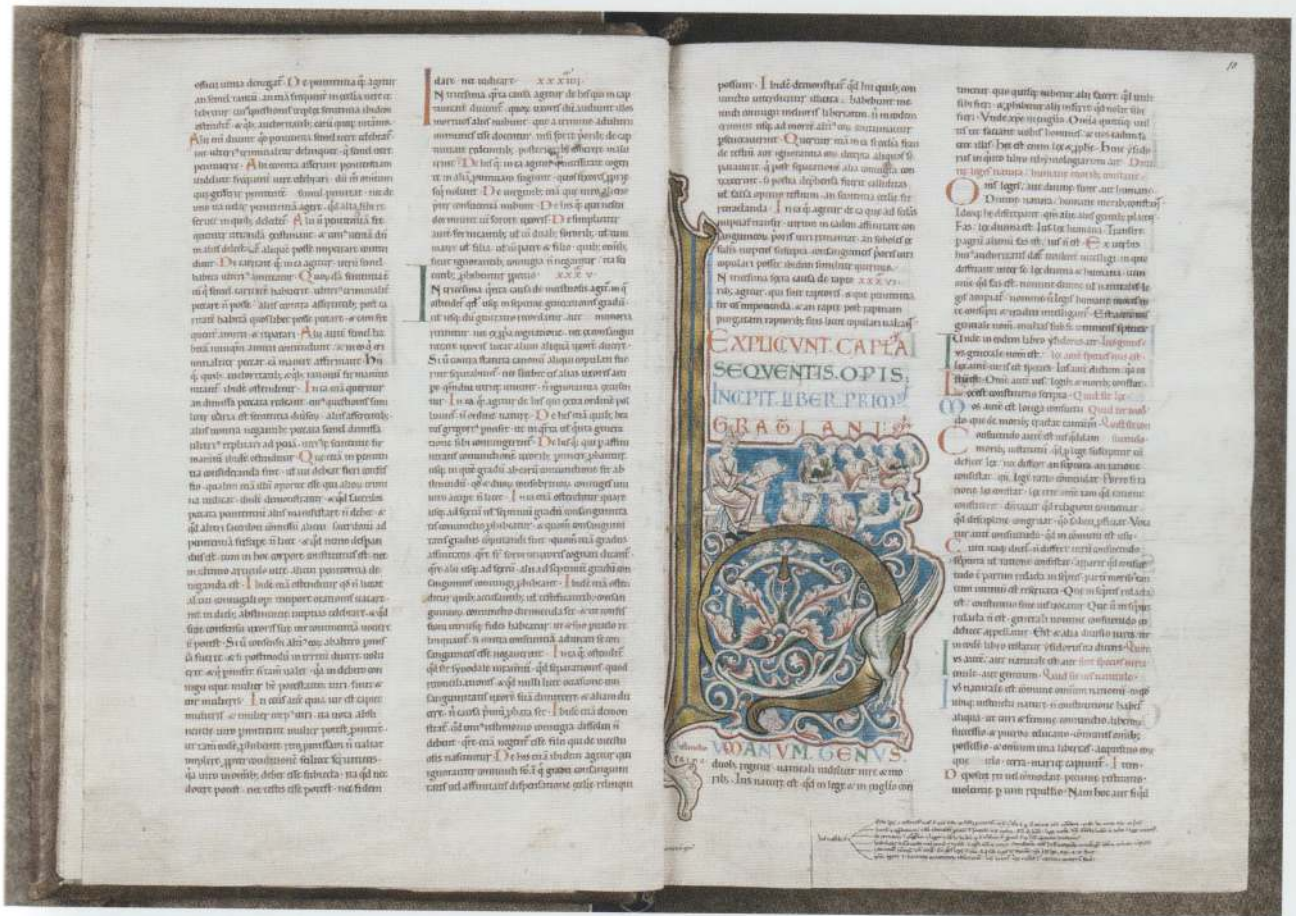
Fig. 6. Décret de Gratien, encre sur parchemin, Saint-Bertin, 3 e quart du XII e siècle, Saint-Omer, BA, ms. 453, f. 10.