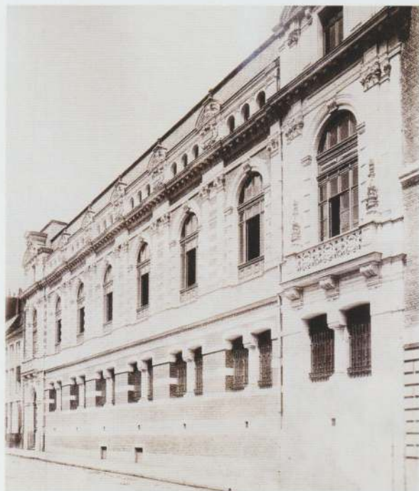
Fig. 3. Saint-Omer, bibliothèque municipale d'étude, façade rue Gambetta, vers 1895

En 1829, lorsque Piers écrit sa lettre au maire, la bibliothèque de Saint-Omer fonctionne depuis presque quinze ans. Entre-temps, ses collections ont été enrichies. Elle compte 4 552 imprimés et 913 manuscrits, totalisant environ 13 000 volumes. Elle est régulièrement fréquentée, à la satisfaction du bibliothécaire qui s'exclame : Oui, je le répète, notre bibliothèque est très utile, et rien n'est plus moral ni plus digne de la vraie philosophie que de contempler des jeunes gens, des militaires, des artistes, des amateurs des lettres, des savants même, employant leurs loisirs à acquérir de nouvelles connaissances, ou à se délasser de leurs travaux dans d'agréables distractions, car la vraie philosophie applaudit aux progrès des lumières, honore les sciences, aime les lettres et les arts, et par conséquent désire le bonheur des hommes ! N'éprouve-t-on pas aussi une satisfaction nationale à voir les étrangers y venir puiser d'antiques renseignements sur notre cité dans les précieux documents qui attestent sa gloire et son importance ! Les partisans de l'ignorance et les ennemis de l'indépendance des gens de lettres blâmeraient seuls l'ardeur que je témoigne en ce moment, mais les arts et lettres ne sont plus comme