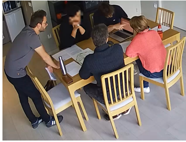
Fig. 1. Explication à l'aide du prototype lors de l'atelier 2