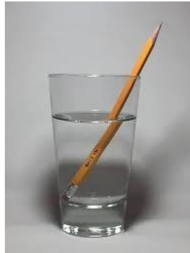
Figure 2. Le crayon brisé