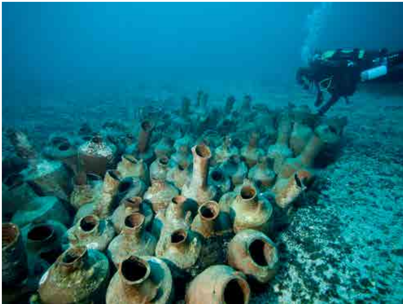
Fig. 2. Mise en place en 2010 de 195 amphores provenant des épaves du Grand Congloué sur le site de Niolon, à Marseille (Bouches-du-Rhône) sur un fond sableux de 14 mètres facilement accessible aux plongeurs.

Depuis les fouilles de la Natière, conduites à Saint-Malo de 1999 à 2008 ( cf. supra , p. 68-73), par Michel L'Hour et Élisabeth Veyrat (Drassm, Adramar) sur deux épaves de navires armés en course, il est devenu fréquent de s'adresser aux publics durant les périodes de chantier afin de les informer sur les opérations archéologiques en cours, leur présenter les premiers résultats et, parfois, des objets tout juste sortis de l'eau. Journées portes ouvertes, conférences, etc., ces actions ont atteint leur acmé avec le chantier de fouille-relevage de l'épave Arles-Rhône 3 en 2011 où, conçue par le département des publics du musée départemental Arles antique et mise en œuvre en collaboration étroite avec les archéologues et les restaurateurs sur le terrain, une programmation très fournie (conférences fluviales, expositions au musée et sur les quais du Rhône, soirées Rhône Movie Party, retransmissions des plongées en direct à l'aide d'une caméra embarquée, etc.) a été proposée aux publics durant toute l'année (Marlier, Djaoui à paraître) (fig. 1). Aujourd'hui, un grand nombre d'opérations archéologiques s'accompagne également d'une conférence