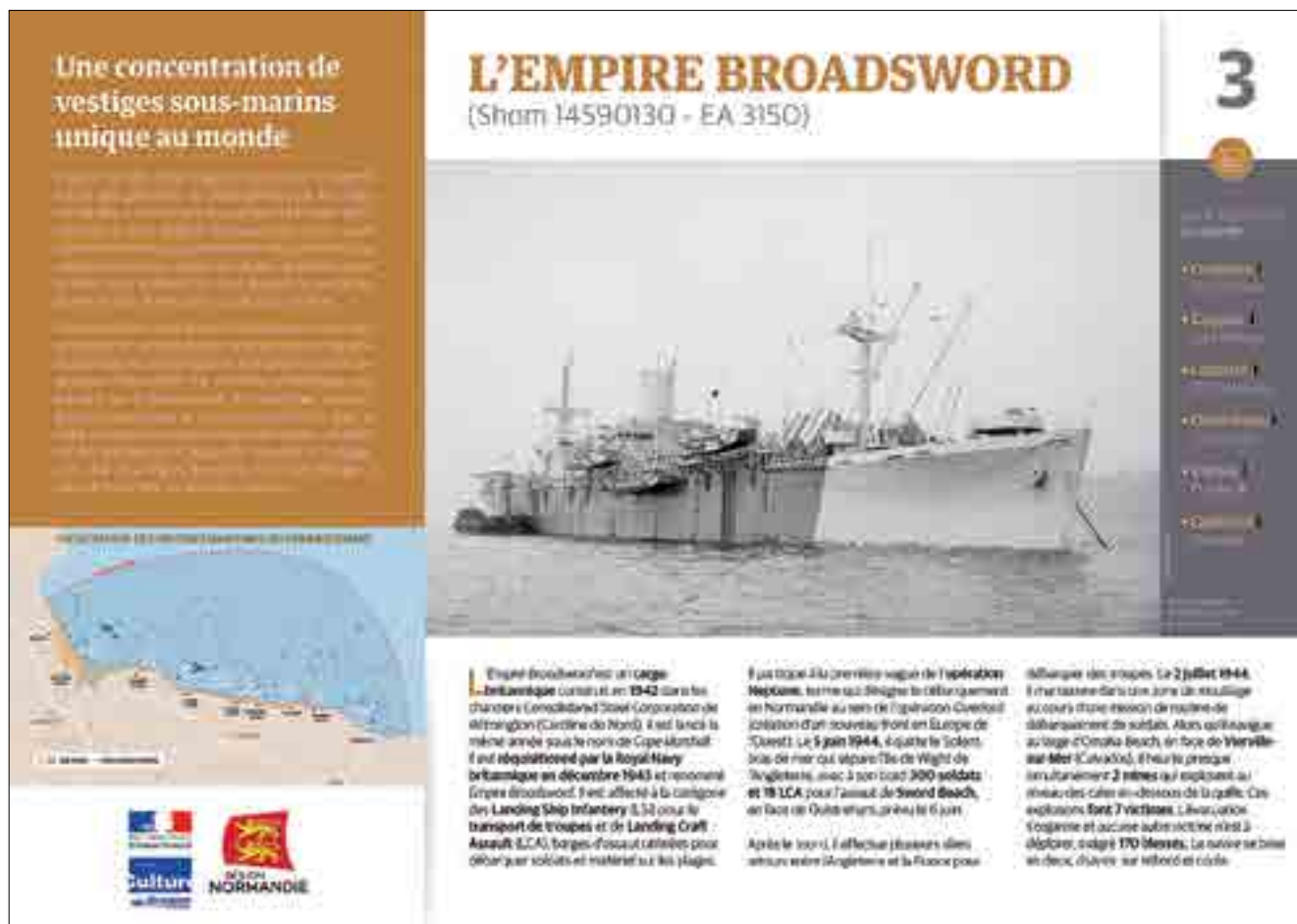
Fig. 4. Recto (p. 276)-verso (p. 277) d'une fiche réalisée à l'intention des plongeurs de Normandie sur le patrimoine sous-marin du débarquement.

développement. De même, les Atlas Ponant ( www.atlasponant.fr ) et PALM ( www.atlaspalm.fr ), conçus et développés respectivement par les associations Adramar et Arkaeos, en lien étroit avec le Drassm 6 , permettent de découvrir via Internet un certain nombre de sites de nos côtes de Manche, Atlantique, mer du Nord et de Méditerranée et d'accéder à la richesse de ce patrimoine immergé. Dans le cadre d'une autre expérience immersive, l'Adramar a réalisé une modélisation 3D de l'épave du Fetlar issue d'un enregistrement photogrammétrique (fig. p. 145) qui permet au public de plonger sur l'épave en réalité virtuelle et augmentée (fig. 5).