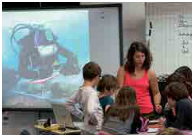
Fig. 6. Atelier de médiation mené auprès des élèves de l'école primaire de Bonifacio (Corse-du-Sud) dans le cadre du chantier-école MoMarch sur l'épave de Paragan.

fouille (Cibecchini (dir.) 2019) et restitué le travail des enfants dans le même temps.