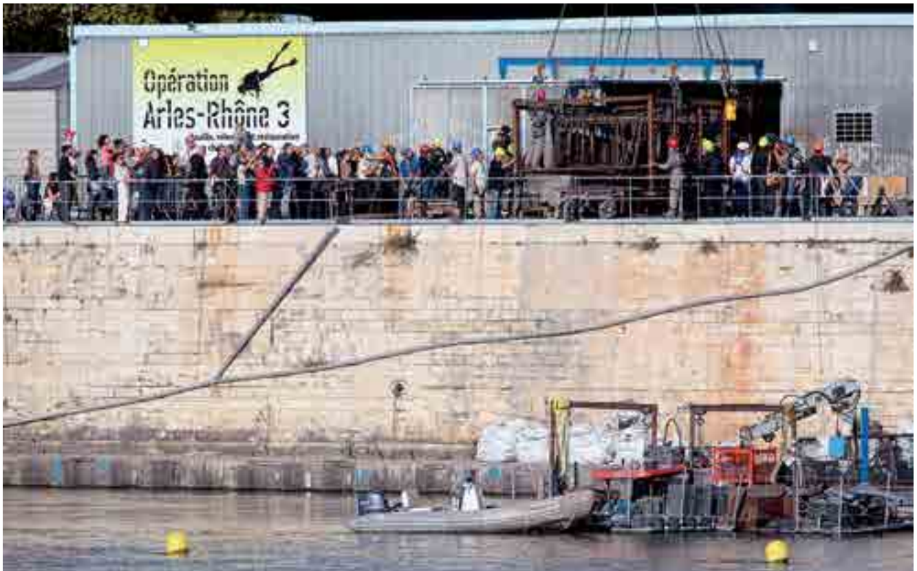
Fig. 1. Relevage d'un des tronçons de l'épave Arles-Rhône 3 en 2011 en présence de publics accueillis, pour l'occasion, dans l'enceinte du chantier. Opération S. Marlier, D. Djaoui (MDAA/CD13), M. El Amouri, S. Greck (Ipsos Facto) 2011.

Ainsi, si l'on prend comme fil directeur la chaîne opératoire qui conduit de la fouille à la présentation des vestiges et des mobiliers aux publics, on s'aperçoit que ce travail de sensibilisation et d'éducation peut se faire à chacune de ses étapes.