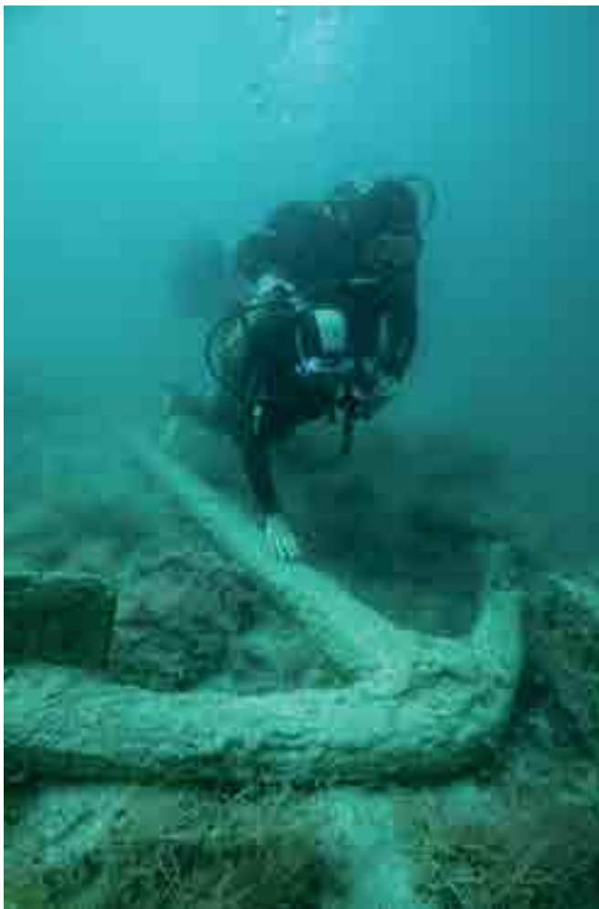
Fig. 3. Visite guidée du site archéologique reconstitué de Bizeux, dans l'estuaire de la Rance (Manche) sur un fond de 4 mètres à marée basse et 15 mètres à marée haute.

Manche, un premier site archéologique reconstitué au pied de la roche de Bizeux, dans la baie de Solidor (Saint-Malo), offre la même possibilité en mobilisant des canons et une ancre trouvés non loin 4 . Un deuxième site a été reconstitué au large de Ploemeur à partir de quatre ancres de corps-mort du XIX e siècle, provenant également de la baie de Solidor. Il est intéressant de noter que ces ancres avaient été sorties de l'eau afin de libérer le fond marin en vue d'aménagements dans la baie. Entreposées tout d'abord sur un parking, leur réimmersion a été autorisée par le Drassm dans le cadre de ce projet de valorisation 5 . Tous ces sites reconstitués sont accessibles librement aux plongeurs, en scaphandre autonome ou en apnée, ou lors de visites guidées par des archéologues comme à Bizeux (fig. 3).