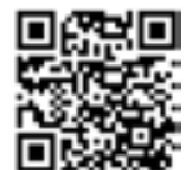
Fig. 5. Épave du Fetlar, une application de plongée virtuelle conçue et proposée par l'Adramar. L'application est accessible en scannant ce QR code. Sans l'application, la visite en vidéo est accessible sur la chaîne Youtube Adramar Association.