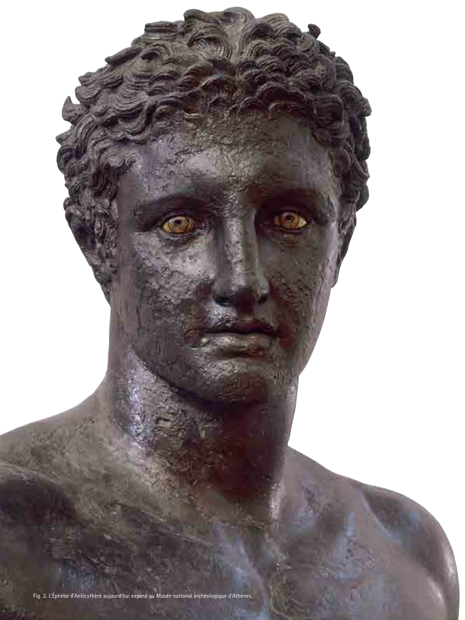
Fig. 2. L'Éphèbe d'Anticythère aujourd'hui exposé au Musée national archéologique d'Athènes.