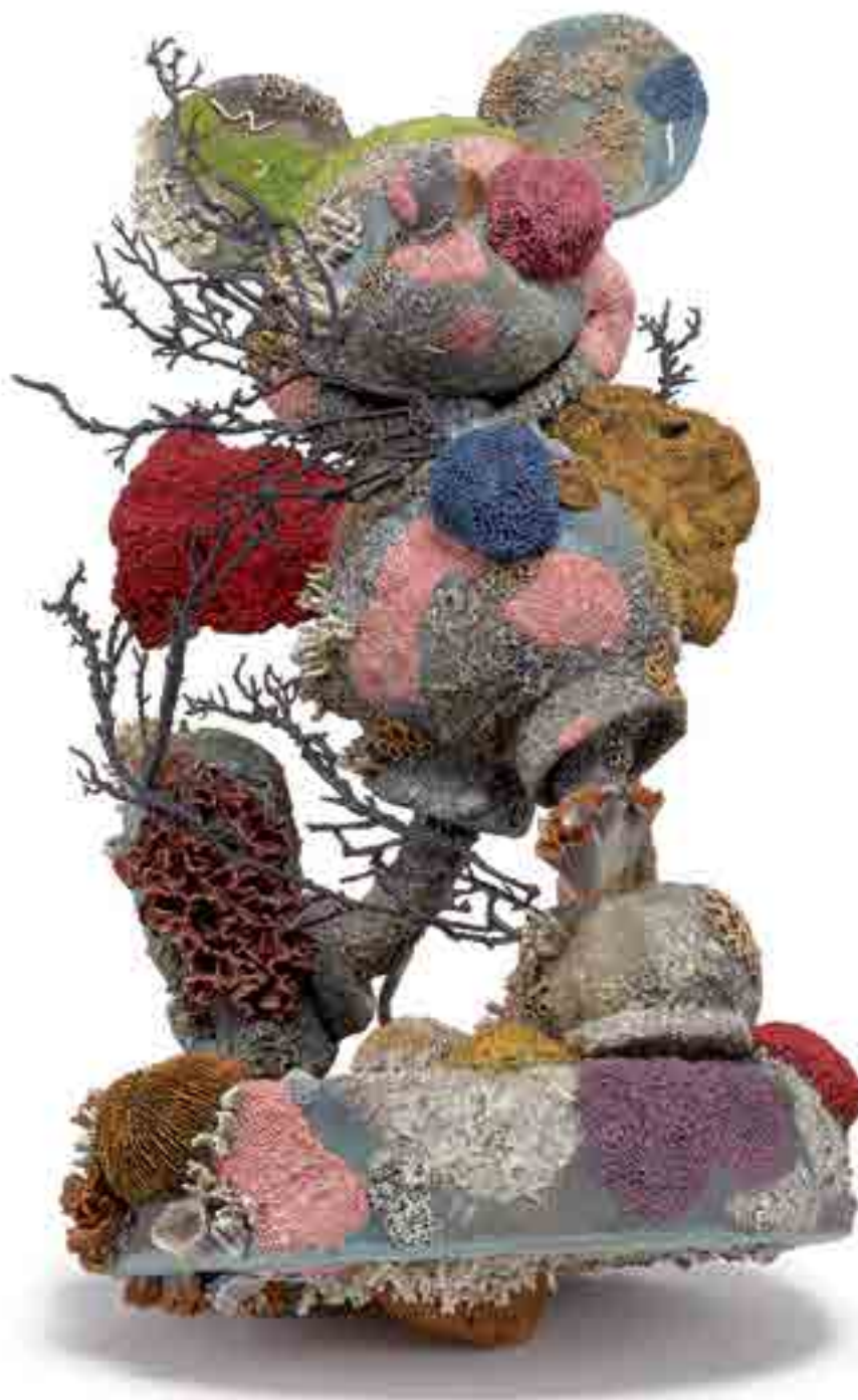
Fig. 5. Statue de Mickey de Damien Hirst, exposition Treasures from the Wreck of the Unbelievable .

metteurs en scène, dont la production croissante est venue à son tour nourrir l'illusion de galions regorgeant d'émeraudes et de pièces d'or ou de sous-marins nazis naufragés avec un chargement de lingots d'or. Des aventures tintinophiles du Secret de la Licorne (1941) et du Trésor de Rackham le Rouge (1944) au Trésor sous cloche de [...] Picsou (2014) (fig. 4), de L'Or à la Tonne de Robert Stenuit (1991) au Cimetière des bateaux sans nom d'Arturo Pérez-Reverte (2001), des aventures de