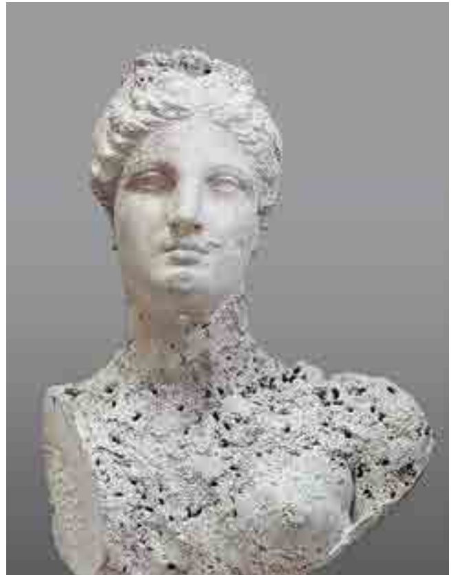
Fig. 3. Buste en marbre d'Aphrodite découvert sur l'épave de Mahdia et aujourd'hui exposé au musée national du Bardo de Tunis.

Qu'ils soient la simple projection littéraire d'une pensée fantasmagorique déjà intériorisée par tous ou plutôt l'expression d'une littérature pionnière qui contribue au XIX e siècle à façonner et fasciner l'esprit de chacun, ces romans ont dans tous les cas popularisé et solidement ancré dans la mémoire collective l'idée que le trésor sous-marin, qu'il soit composé de statues de marbre, de bronzes antiques, de coffres remplis de pierres précieuses, de pièces de huit ou de lingots d'or, justifie, plus encore que son homologue de terre ferme, qu'on se mette à sa quête car sa mise au jour puis son appropriation permettront de prodigieusement s'enrichir et de changer radicalement de vie.