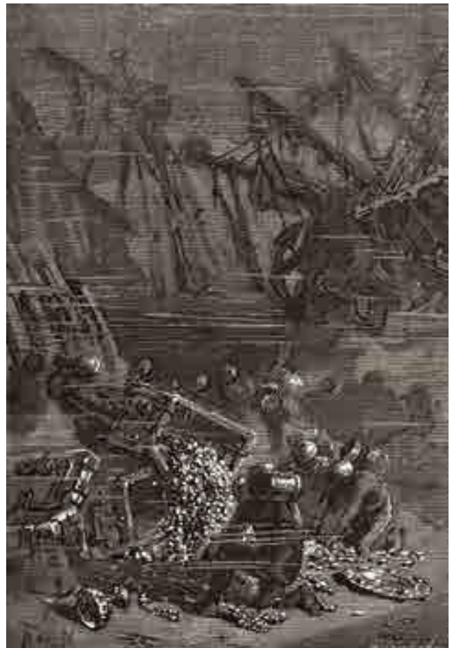
Fig. 1. Récupération du trésor au fond de la baie de Vigo (gravure sur bois d'après le dessin de A. de Neuville, vol. 2, première édition de Vingt Mille Lieues sous les mers , 1869-1870).

L'analyse du champ sémantique qui associe si régulièrement la notion de trésor et le patrimoine culturel sous-marin mériterait d'ailleurs de ne pas rester exclusive, les musées faisant eux-mêmes, pour ne citer qu'eux, un usage quasi forcené du mot en l'accolant à presque tous les sujets. Sur le seul web francophone, on recensait notamment en fin d'année 2021 et au début de l'année 2022 : Trésor révélé (des biens d'église), à Lille ; Les Trésors de la collection Al Thani (des œuvres d'art), à l'Hôtel de la Marine, à Paris ; Mon Corps Trésor (des œuvres de femmes qui ont appris à aimer leur corps), en Narbonnaise ; Trésors de Banlieues (l'effervescence artistique des banlieues), à Gennevilliers ; Mon Précieux... À chacun son Trésor (de