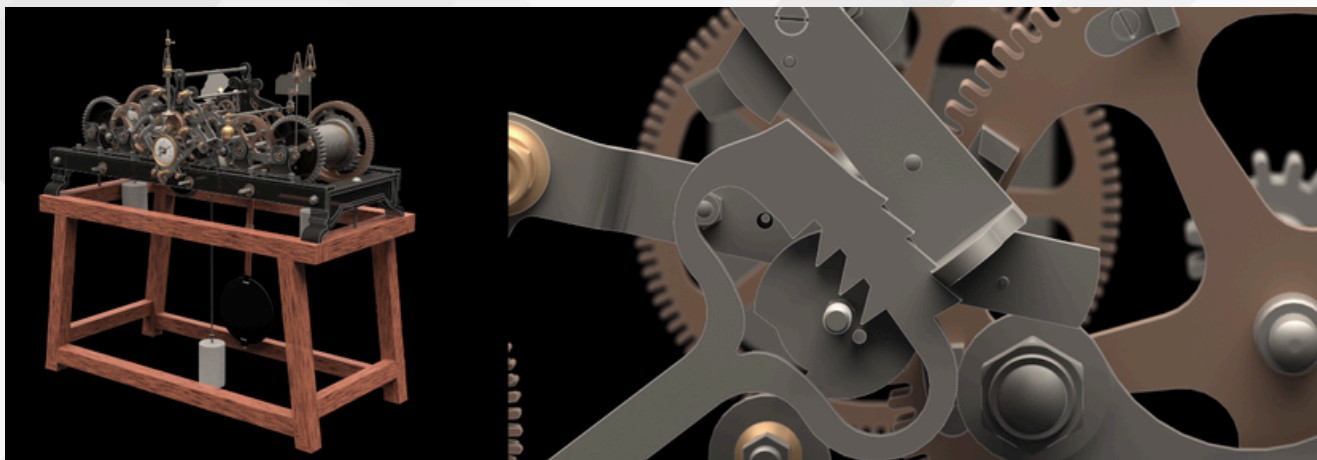
Figure 2. Captures d'écran du rendu vidéo

Un export sous forme de maillage au format GLB (version binaire du GLTF) est aussi généré. C'est à partir de celui-ci qu'un travail est fait avec Blender pour créer une animation vidéo et un export du modèle en GLB qui peut aussi comporter des animations.