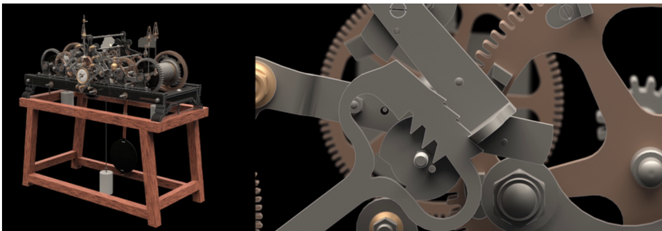
Figure 2. Captures d'écran du rendu vidéo

Un export sous forme de maillage au format GLB (version binaire du GLTF) est aussi généré. C'est à partir de celui-ci qu'un travail est fait avec Blender pour créer une animation vidéo et un export du modèle en GLB qui peut aussi comporter des animations.