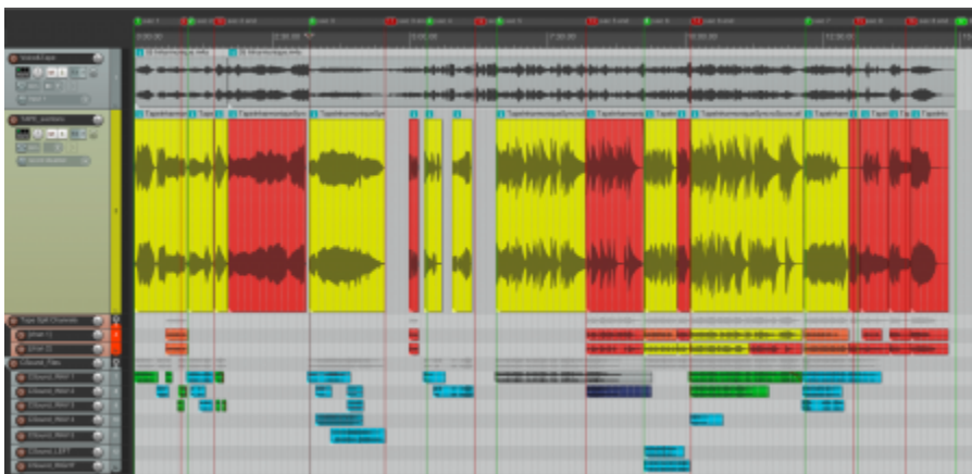
Figure 1. Projet Reaper d' Inharmonique mettant en évidence la situation des différentes composantes de la bande par rapport à (Lorrain 1980).

13Sur le projet Reaper (figure 1), nous donnons un aperçu d'ensemble d' Inharmonique , concernant l'identification des divers éléments d' Inharmonique .