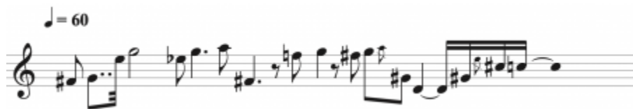
Figure 5. Transcription Section VIII, soprano (transcription approximative). Passage intégré dans les séquences IR, IRR1, IRR3 et IRR4.

39Ce passage a justifié le développement de la nouvelle version. La nécessité de re-coder ce passage a convaincu Risset de l'importance du développement de la nouvelle version (De Sousa Dias, 2018). À ce moment-là, l'électronique dialogue avec la soprano. Pour la version de 1977, Risset a utilisé l'enregistrement d'Irène Jarsky (Audio 5). Dans la nouvelle version (Audio 6), le patch s'adapte à chaque soliste. Pour notre version, nous avons enregistré ce passage dans la salle même du concert lors d'une répétition et ensuite généré un fichier sonore qui est lancé par le patch de concert. Nous avons également ajouté les sons de percussion régénérés avec Csound .