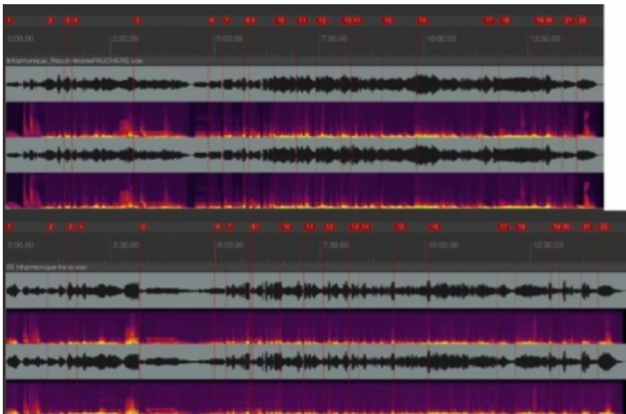
Figure 6. Comparaison (forme d'onde et sonagramme) des versions d' Iharmonique : nouvelle version (haut), version de la création (bas).

45L'analyse comparative de deux passages nous permettent de synthétiser quelques caractéristiques de notre démarche. Tout d'abord, au minutage 10'00" de la bande originale (Audio 7), événement 16 de notre version, grâce à la souplesse chronométrique de la nouvelle version, la soliste a plus de temps pour articuler le motif initial (Audio 8). Après ce motif, dans la version de 1977, la soliste est plus libre et son intervention est moins présente que dans la nouvelle version.