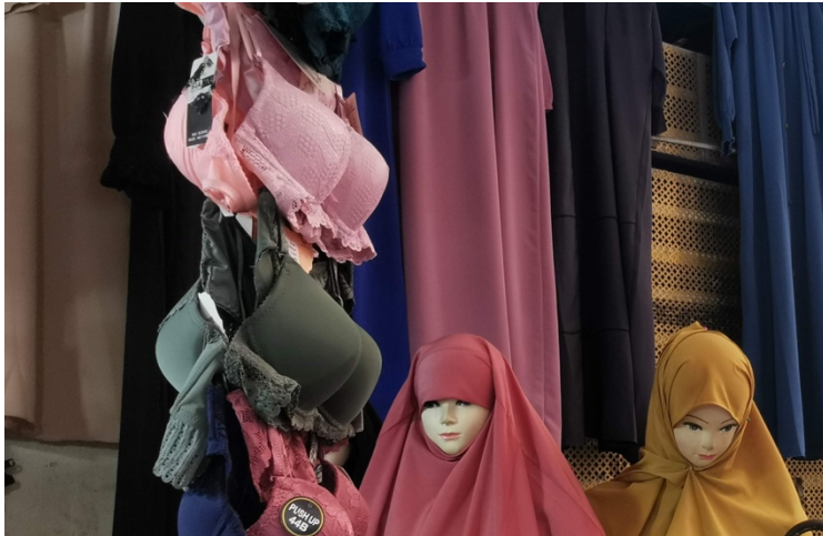
Tunis 2022

des sociétés arabes à la corporalité féminine. La complexité des enjeux sociétaux liée à la représentation du corps féminin est au cœur de la problématique du film Dunia (2006). Le traitement cinématographique que lui réserve Jocelyne Saab est tout fait subtil car elle parvient à associer la sensualité orientale à la pudeur sociétale égyptienne et à ses tabous sur les corps dénudés et les corps dansants. Elle souligne visuellement les paradoxes sur la nudité féminine en filmant les vitrines des magasins de sous-vêtements du Caire affichant des dessous féminins particulièrement effrontés qui ne correspondent pas à l'éthique islamique. Des images dans Dunia (2006) interpellent le spectateur sur les paradoxes du halal et du haram en rapport avec la visibilité/invisibilité du corps féminin.