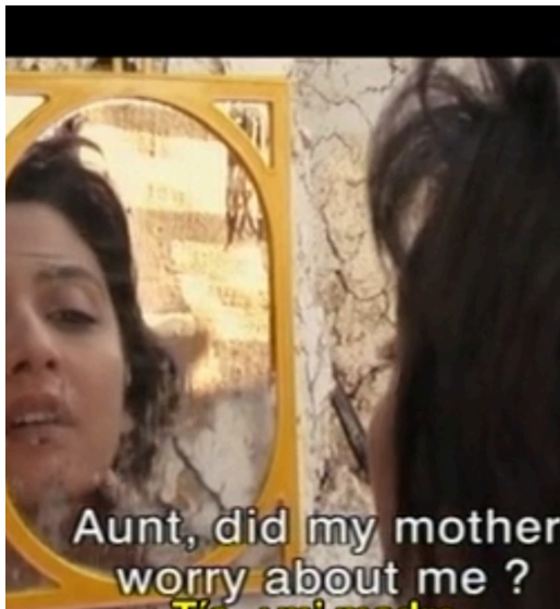
Les Almées (1989)

Une image peut résumer une situation très complexe de mille mots comme l'affirme le sens commun. L'icône du miroir est un leitmotiv de la filmographie de Jocelyne Saab. Il revient de façon paradigmatique dans les documentaires et les fictions avec des scènes de femmes ou de petites filles comme dans Les Almées, danseuses orientale (1989). Les scènes de miroir sont présentes dans de nombreux films de fiction tels les vitres brisées des immeubles de Beyrouth.