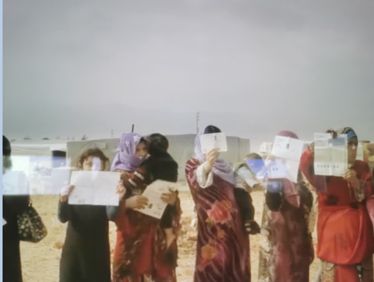
One dollar a day (2016). Capture d'écran

Le cadrage est un construit de mise en scène qui nous éloigne du documentaire et produit un effet hybride des deux genres.