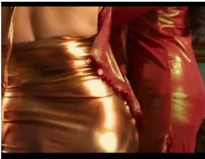
Dunia (2006). Une sensualité jamais vulgaire.

Jocelyne Saab évoque dans Café du genre (Fortier, 2021) la relation problématique des sociétés arabes à la sensualité. Le film élabore une critique qui existait déjà dans Dunia et dans d'autres films sur les danseuses orientales.