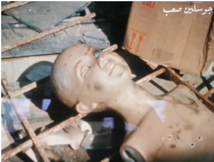
Beyrouth, Jamais plus (1976).

de genre. Ce qui interroge le regard féminin, c'est une attention aux détails inattendus montés avec des travellings de désolation. Les pillages des enfants dans la ville, qui, dans la Beyrouth assassinée sont filmés comme des actes d'affirmation de la vie et du « malgré tout ». Les enfants nous livrent des danses vitales au cœur des démolitions. Des plans de coupe permettent une juxtaposition de vie et de mort. Ils expriment quelque chose de très féminin par le choix même des objets sur lesquels elle effectue un arrêt sur image : des disques cassés, des mannequins désarticulés, une jambe, une main, une poupée éclatée.