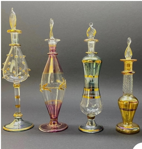
Fioles de parfum orientales (Amazon)

Dunia (2006) que s'épanouit son female gaze avec un cadrage féminin, une mise en scène des corps traduisant une pudeur particulière. Dans le film le désir est traité de manière poétique. Il s'agit de poésie du désir. Il n'est pas question de pornographie ou d'érotisme dans la problématique du désir. Jocelyne Saab traite le désir telle une musique avec des visages qui chantent. Une scène du mariage dans Dunia (2006) essentialise le mariage avec l'image d'une armoire sur un camion. Ces scènes sont pour moi la traduction d'un female gaze . Une série de détails synthétise une situation. Par exemple, celle de la nuit de noces est résumée par une scène où l'héroïne essaie des parfums, se parfume elle-même, hume les fragrances.