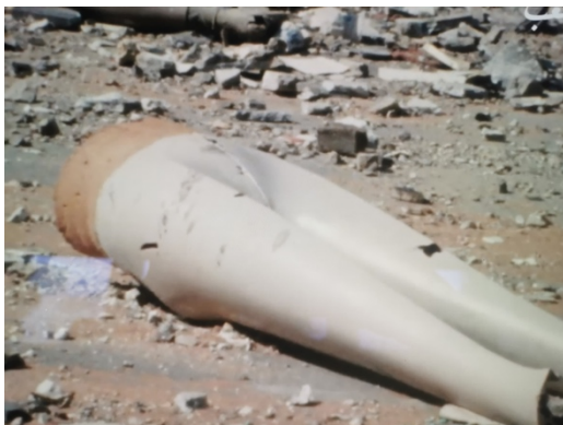
Beyrouth, jamais plus (1976). Arrêt sur image/carte postale

Ses films sont des dépassements de la guerre qu'elle exprime dans sa grammaire des débris et des-presque-riens. Le female Gaze dans Beyrouth, jamais plus (1976) se manifeste dans « l'ordinarité » de ces Beyrouthins qui marchent dans la rue avec des tomates dans les mains dans des situations complètement inattendues. Le quotidien de combattants qui lisent Tintin, un combat de coq, un chat que l'on voit deux fois, des jouets tachés de sang, des enseignes de magasins, un son discordant. Le mal est banalisé par les activités journalières. Des clichés, tels des cartes postales, qu'elle égrène dans une prise de vue directe, comme des arrêts sur image.