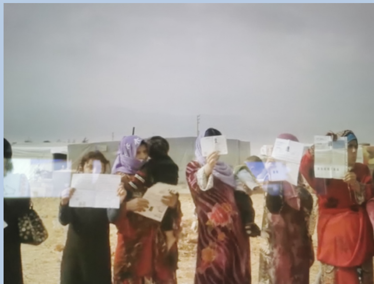
One dollar a day, 2016, capture d'écran

Du reportage contraint par les chaînes de télévisions françaises - exigeant un message volontairement clair et neutre - à l'expression d'un engagement imagétique qui se traduit par une approche poétique subjective, le turning point se situe avec les documentaires de l'année 1976 où la cinéaste se met en scène dans Beyrouth, jamais plus (1976) et Beyrouth, ma ville (1982). Deux documentaires, qui, progressivement, travaillent la forme poétique et abstraite qui seront plus prolongés et approfondis avec les films de fictions tels que : Une vie suspendue (1985), Dunia (2006), What's Going On (2009) et One dollar a day (2016). Des films, qui, à bien des égards, interrogent une montée en puissance d'un female gaze notamment avec le documentaire A dollar a day, 2016 qui met en image des femmes réfugiées en rang d'oignons affichant leurs certificats de réfugiées (Fortier, 2019).