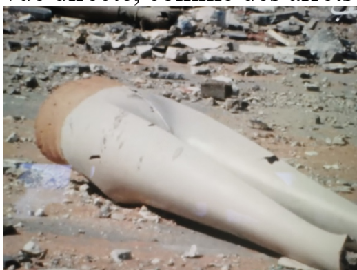
Beyrouth, jamais plus, 1976 Arrêt sur image/carte postale

Ses films sont des dépassements de la guerre qu'elle exprime dans sa grammaire des débris et des presque riens. Le female Gaze de J.S ( Beyrouth, jamais plus, 1976 ) se manifeste dans « l'ordinarité » de ces beyrouthins qui marchent dans la rue avec des tomates dans les mains dans des situations complètement inattendues, des combattants qui lisent Tintin, un combat de coq, un chat que l'on voit deux fois, des jouets tachés de sang, des enseignes de magasins, un son discordant. Des clichés, tels des cartes postales, qu'elle égrène dans une prise de vue directe, comme des arrêts sur image.