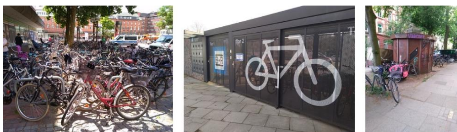
Figure 9.3. Stationnement sur voirie à proximité de la gare d'Altona, stationnement sécurisé en gare (B+R) et Fahrradhäuschen à Hambourg (Eskenazi 2018)

modal dans la périphérie de l'agglomération vers le transport ferré, dans l'optique établie par les plans climat de réduction des émissions de polluants. Mais si on regarde les chiffres, la part des déplacements intermodaux vélo + transport public reste faible : elle représente moins de 1 % de l'ensemble des déplacements, comme en 2008 (MiD 2017). Pourtant il n'est pas rare de trouver les parkings vélos remplis aux abords des gares ferroviaires (figure 9.3).