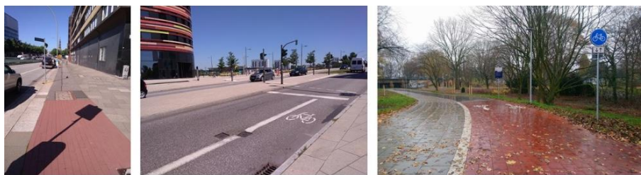
Figure 9.2. Trois types d'aménagement à Hambourg : les bandes sur trottoir ( Getrennte Geh- und Radweg ), les bandes sur route ( Radfahrstreifen ) et les véloroutes ( Velorouten ) (Eskenazi 2018 ; 2020)

portés par les arrondissements. Ces derniers sont compétents pour planifier des aménagements de voirie locaux : ce sont eux qui gèrent 68 % des routes sur le territoire. Les services techniques des arrondissements peuvent donc mettre en place des schémas directeurs locaux, et proposer de nouveaux aménagements cyclables sur des itinéraires hors véloroutes : ceux-ci sont majoritairement des bandes cyclables, pistes cyclables, vélorues ou doubles-sens cyclables (figure 9.2). Cependant, la mise en œuvre de ces projets secondaires se heurte à plusieurs obstacles, en premier lieu celui du financement. C'est la ville, à travers le département de l'économie, du transport et de l'innovation ( Behörde für Wirtschaft, Verkehr und Innovation – BWVI ) 3 qui finance les travaux de voirie ; l'essentiel du budget alloué au vélo dans l'alliance pour le vélo va à la construction des véloroutes. Les arrondissements établissent chaque année la liste des projets qu'ils souhaitent mettre en place, et font une demande de budget à l'administration centrale, qui peut être complétée ensuite pour des projets importants.