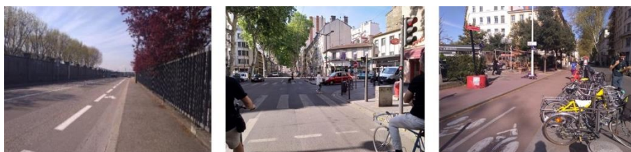
Figure 9.5. Trois types d'aménagement cyclable dans le Grand Lyon : bande sur voirie, voie bus+vélo et piste cyclable bidirectionnelle (Eskenazi 2019 ; 2020)

Les premiers plans stratégiques sur le vélo n'ont pas proposé de vision cohérente de la construction d'un réseau cyclable sur le territoire. Des axes structurants sont identifiés dès 1996 sur la ville de Lyon (Baldasseroni 2019), et le plan modes doux de 2009 distingue bien deux niveaux d'itinéraires cyclables : un réseau structurant qui doit assurer les liaisons intercommunales, et un réseau cyclable secondaire pour une desserte fine du territoire et de rabattement sur les transports publics. Les aménagements dédiés ne sont pas les mêmes pour ces deux réseaux, les aménagements sur voirie et séparés (bandes cyclables, voies bus, pistes cyclables) étant privilégiés pour le réseau structurant, et les aménagements en mixité notamment dans les zones 30 pour le réseau secondaire.