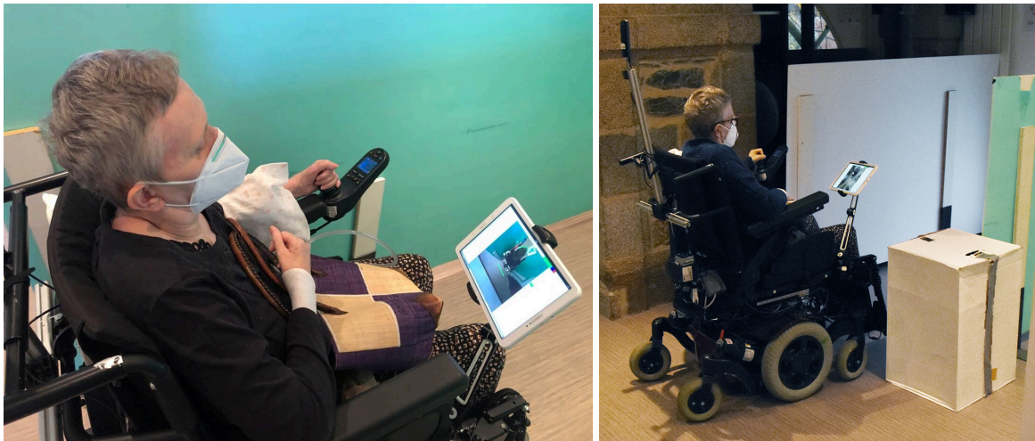
Figure 1 : Le système d'aide à la conduite basé vision panoramique, SpheriCol, utilisé par un patient

repérer sur une tablette fixée au fauteuil les éléments de l'environnement grâce aux mesures des capteurs de distance et à une caméra omnidirectionnelle compacte fixée derrière le dossier du fauteuil (fig. 1). Une première étude d'usage par des patients du Pôle Saint Hélier a confirmé l'intérêt d'un tel système pour l'aide à la conduite dans des environnements exigus et fortement encombrés : sortie en marche arrière d'un ascenseur, passage par l'embrasure d'une porte, changement de direction dans un couloir étroit, etc.