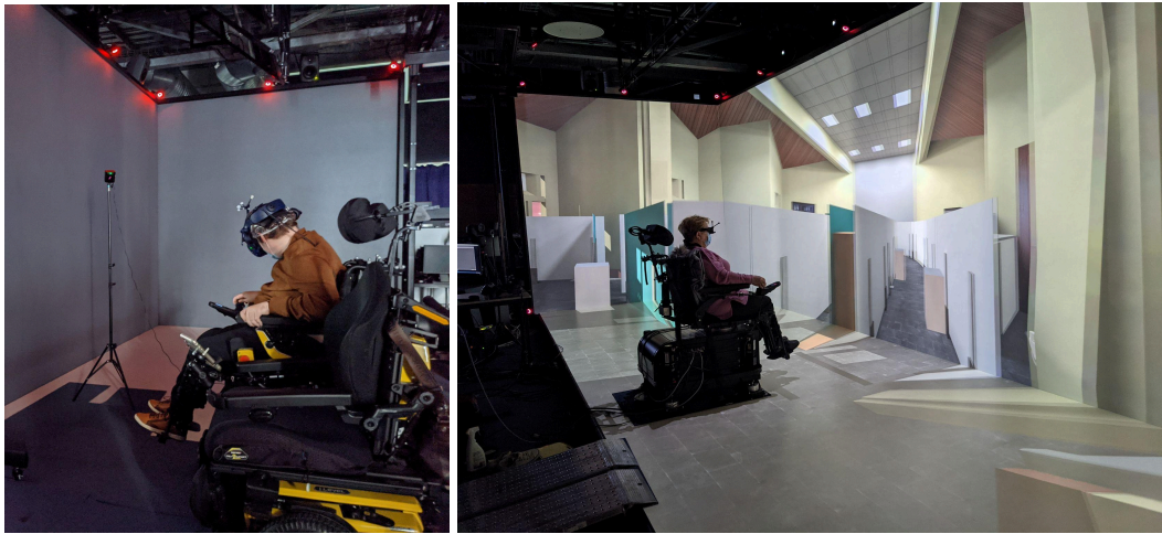
Figure 2 : Simulateur de conduite de FRE en réalité virtuelle : casque et salle immersive (étude clinique SIMADAPT2)