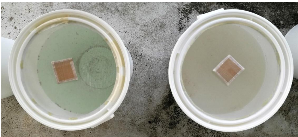
Fig. S2 Comparison of the visual aspects of control (left) and treated (right) container when testing a Sextonia rubra wood extract-based formulation against Aedes aegypti larvae in semi-field conditions