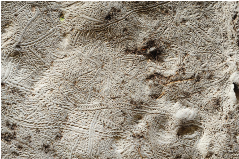
Traces dans le sable (sans doute des scarabés) à Kumawa (Indonésie).