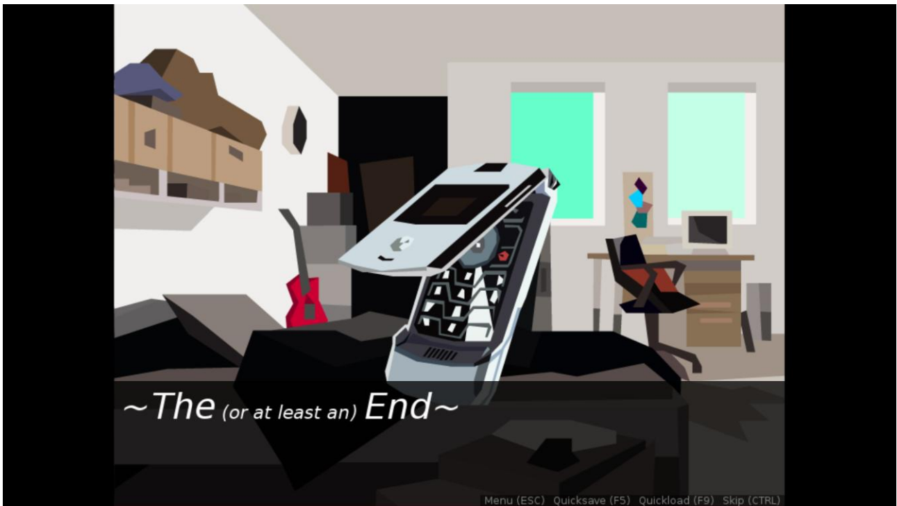
Chris Cornell, Save the Date , capture d'écran, 2013, l'un des écrans de fin.

Ce dernier s'amuse alors, par les lignes de dialogue, à intégrer directement le joueur ou la joueuse au sein de la fiction. Par des allusions à sa recherche désespérée de sauver Felicia en sautant d'une sauvegarde à l'autre, comme « Vous n'êtes pas vraiment surpris·e 11 », ou « le médecin vous annonce, le visage blême, ce que vous saviez déjà au fond de vous 12 », le jeu brise la distance entre la fiction et le joueur ou la joueuse. Cet aspect trouve son apogée dans la possibilité laissée par le jeu d'avouer à Felicia qu'elle est un personnage de jeu vidéo, lors d'une scène extérieure se situant à « Hogwarts 13 »