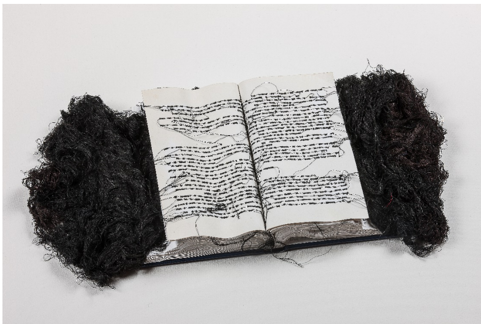
Fig. 1: Maria Lai, Libro scalpo n.3 , 1987, carta, filo, 23 x 47 cm courtesy © Archivio Maria Lai by SIAE 2023

pensieri e i sogni”. L’augurio è quello di un dialogo con “l’altro da sé, fratello e straniero”». 20