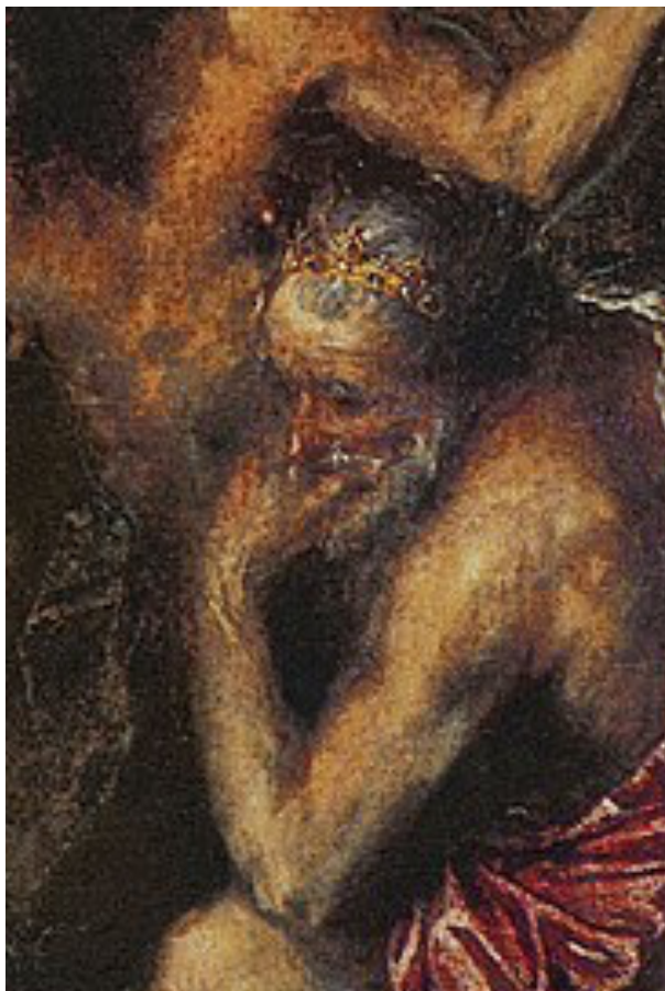
Fig. 4: Tiziano Vecellio, Lo scorticamento di Marsia (dettaglio)

Il poeta, ci dice Anedda interpretando le intenzioni di Herbert, è Marsia: punito per la sua hybris dal potere rappresentato da Apollo. Ma l'apologo inscenato da Tiziano è più complesso, forse, di come ci venga presentato qui. Se è il sangue di Marsia che fa nascere un'arte nuova , il poeta sarà colui che di questo scempio si nutre (appunto raffigurandolo nei suoi versi crudeli): se non il giovane Apollo che comunque, non dimentichiamolo, è un artista a sua volta – detiene un potere, sì, ma è quello sull'arte rappresentato dal tradizionale serto d'alloro: infatti il suo coltello potrebbe assomigliare giusto a un pennello –, magari il vecchio Mida che, cinto a sua volta da corona, assiste impassibile alla scena, forse meditando sull'opera da farsi (quella che contempliamo, cioè). In ogni caso, come scrive Agamben ricordando l'invocazione ad Apollo del Paradiso , di un Dante che fervido anela a essere scuoiato dal dio («Entra nel petto mio, e spira tue | sì come quando Marsia traesti | de la vagina de le membra sue»), «lo scorticamento di Marsia è qui una