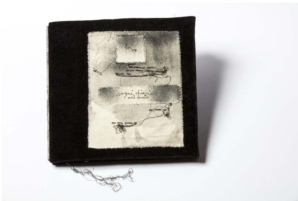
Fig. 2: Maria Lai, Sogni chiari nel buio , 2009, filo, spago, stoffa, tempera, velluto, 31,5 x 32 cm

Adele Bardazzi, infatti, nel suo saggio dedicato ad Anedda e Lai, mette in luce appunto il processo, cioè la riflessione del « in the making » 21 presente in questi due laboratori, che tocca la grammatica del poetico, anzi le percezioni di determinate strutture-basi di questo stesso linguaggio. C'è un'etica nei confronti di questo altro, c'è un'esigenza della presenza dell'altro che non lo elimina, ma lo riconosce e lo accoglie, scuotendo e facendo tremare le fondamenta del linguaggio. È qui che il significato, precipita da un abisso all'altro, rischiando di perdersi in profondità, in una lontananza; o per continuare con le parole di Anedda nel suo più recente Geografie (2021): «Sgretolarsi significa putrefazione ma anche cambiamento» e ancora «Il sonno era arrivato poco dopo, in camera, insieme al vocio di una lingua straniera che spesso è uno dei sonniferi migliori». 22 La complessa performance messa in atto in Nomi Distanti mette in evidenza lo spazio sempre più sfilacciato dell'«io»: «Chi risponde deve tener conto dell'aria e del fragore, del freddo, del tremore dell'onda, del tremore del fiato: per capire il