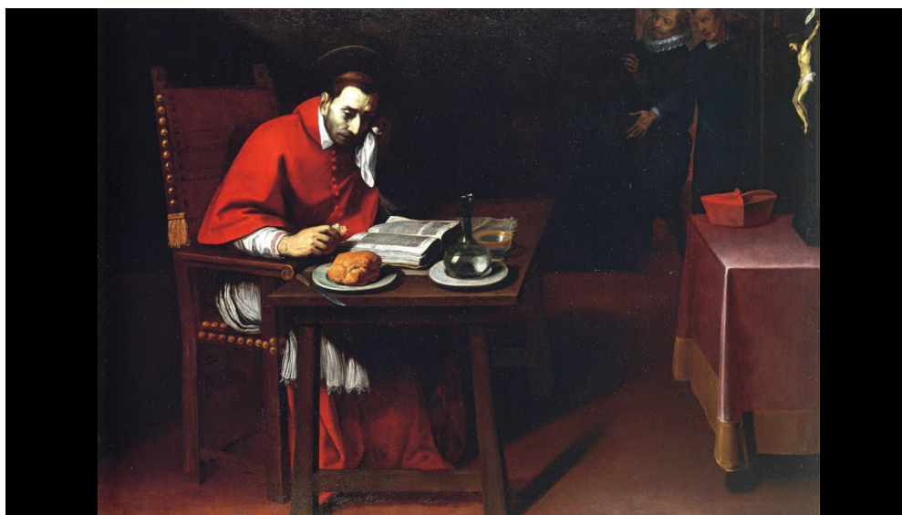
Fig. 1: Daniele Crespi, Il digiuno di San Carlo , 1628-1629, olio su tela, 190×265 cm, Chiesa di Santa Maria della Passione, Milano

Quando in un altro suo testo Manganelli ci fa notare, nella meditazione di Carlo Borromeo dipinta da Daniele Crespi, il dettaglio del coltello che sporge verso di noi dal desco frugale del Santo, ci mostra tutta l'aggressività con la quale l'immagine «punta alla gola dello spettatore, del devoto» 105 .