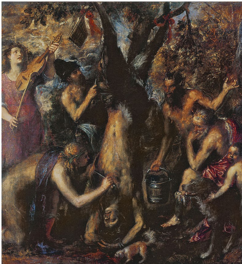
Fig. 3: Tiziano Vecellio, Lo scorticamento di Marsia , 1570-1576, olio su tela, 212×207 cm, Museo Arcivescovile, Kroměříž