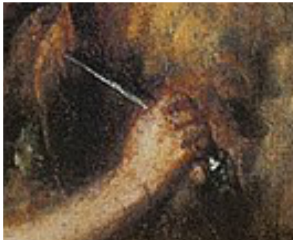
Fig. 5: Tiziano Vecellio, Lo scorticamento di Marsia (dettaglio)

L'artefice, al contempo vittima e carnefice come sosteneva Baudelaire, è Marsia, sì, ma un po' anche Apollo; e soprattutto è Mida, a tutti i costi determinato a tradurre nell'oro della propria arte nuova , così rinvigorendo le sue membra esauste, il sangue che vede scorrere nel mondo. Il dio della storia ci entra nel petto , e irresistibile spira : si anima incarnandosi ogni volta, spietato, in nuovi corpi a lui offerti in sacrificio. Stavolta, a quanto pare, tocca a noi. Questo il prezzo dell' ispirazione che gli chiediamo. 120