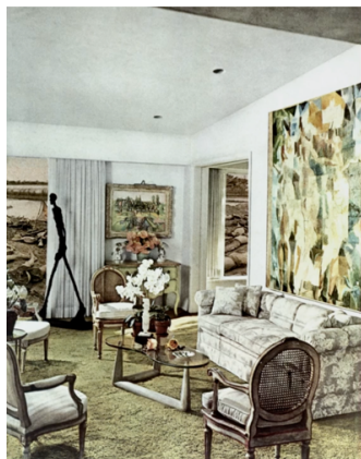
Fig. 10 e 11: Martha Rosler, Cleaning the Drapes from the series House Beautiful: Bringing the War Home , c. 1967-1972. Courtesy of the artist; Martha Rosler, House Beautiful: Giacometti from the series House Beautiful: Bringing the War Home , c. 1967-72. Courtesy of the artist.