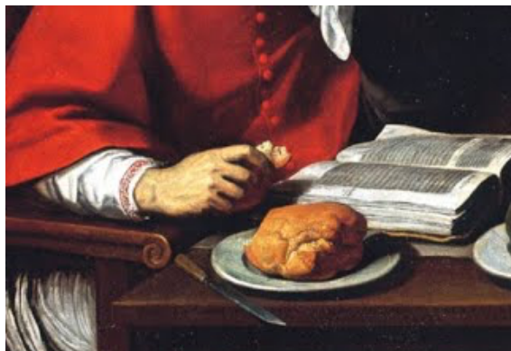
Fig. 2: Daniele Crespi, Il digiuno di San Carlo (dettaglio)

Dalla violenza immobile dell'arte è dato difendersi, insomma, solo esercitando violenza a nostra volta: nell'incidere quelle immagini, anatomizzarle, più o meno pietosamente amputarle. Cioè sottoporle a un movimento che loro non appartiene, ma a noi sì (almeno per il momento). I «ritagli» delle immagini, lacerti sezionati a viva forza dagli organismi pittorici ai quali originariamente appartenevano, 106 giacciono sulla pagina non troppo diversamente dai brandelli di corpi umani ai piedi della cavalcatura di San Giorgio, nell'«istoria» di Carpaccio agli Schiavoni (quei «resti di fanciulle e giovinetti, in diverse fasi di disseccamento o appena sbranati», spiegava Calvino, sono «le vittime che gli abitanti di Selene, città d'Oriente, sono obbligati a offrire in pasto ogni giorno a un drago feroce» 107 ). È una similitudine violenta ma la fa la stessa Anedda, in un componimento apicale di Dal balcone del corpo (2007), Parla lo spavento :