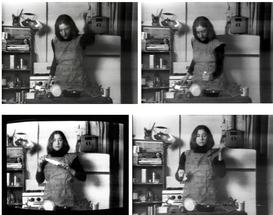
Fig. 6, 7, 8 e 9: Martha Rosler, Semiotics of the Kitchen , 1975. Courtesy of the artist.

All'inizio l'andamento è di pacato didascalismo, due oggetti però non casualmente interrompono il ritmo di quest'armonia dissonante, ice-pick e knife , angoli privilegiati per esplorare altre zone. In effetti, si nota bene il modo con cui la Rosler impugna il coltello e il picchetto da ghiaccio. Nelle ultime lettere (U, V, W, X, Y e Z) gli attrezzi da cucina vengono sostituiti dai gesti corporali di Rosler, i quali intensificano la problematizzazione dell'uso quotidiano dei significanti e significati della cucina. Secondo Rachel Haidu: «[...] Rosler's parodic demonstration, it seems clear that she is showing us how objects can be misused, their use-value or utility evacuated». 38 L'operazione e il montaggio artistico in questo caso permettono la critica del segno e del suo valore d'uso: «La cucina è un promontorio. Le pentole sono scogli divorati da un vento-lupo che soffia e corre in cerchio nell'isola» 39 o ancora in un verso più agghiacciante di Salva con nome : «Posiamo con cura i tovaglioli / e dal lino si sollevano demòni». 40