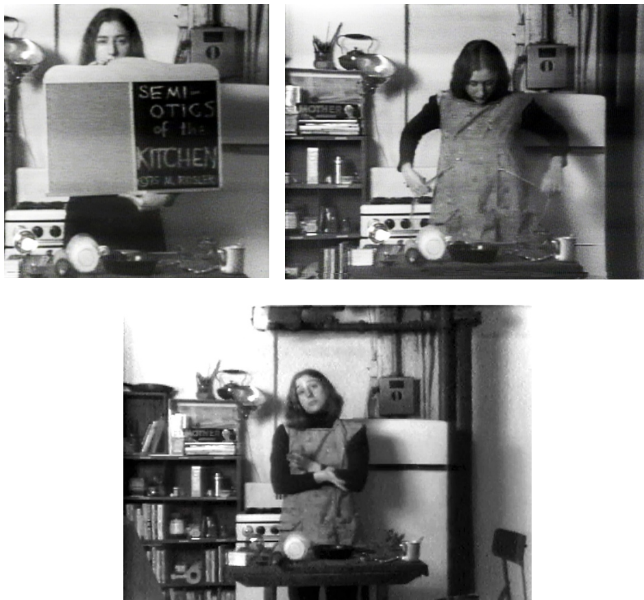
Fig. 3, 4 e 5: Martha Rosler, Semiotics of the Kitchen , 1975.

Semiotics of the kitchen inizia con uno zoom che inquadra la protagonista e una lavagna, sulla quale c'è scritto il titolo del video ed il copyright. Poi la protagonista veste il primo elemento dei suoi attrezzi, cioè, il grembiule («apron» in inglese, pezzo emblematico della casalinga), e procede in ordine alfabetico («ogni mattone compone un alfabeto in rovina») 36 pronunciando il nome e facendo vedere degli oggetti davanti e vicini a sé. Helen Molesworth nel suo saggio House Work and Art Work , 37 mette in risalto il fatto che sullo sfondo del video c'è non casualmente un libro il cui titolo è MOTHER , il quale di per sé evocando le figure della madre e della moglie si presenta anche come un segno della rottura provocata dall'atteggiamento bizzarro della performance; pare, dice inoltre la Molesworth, un pezzo scritto da Bertolt Brecht.