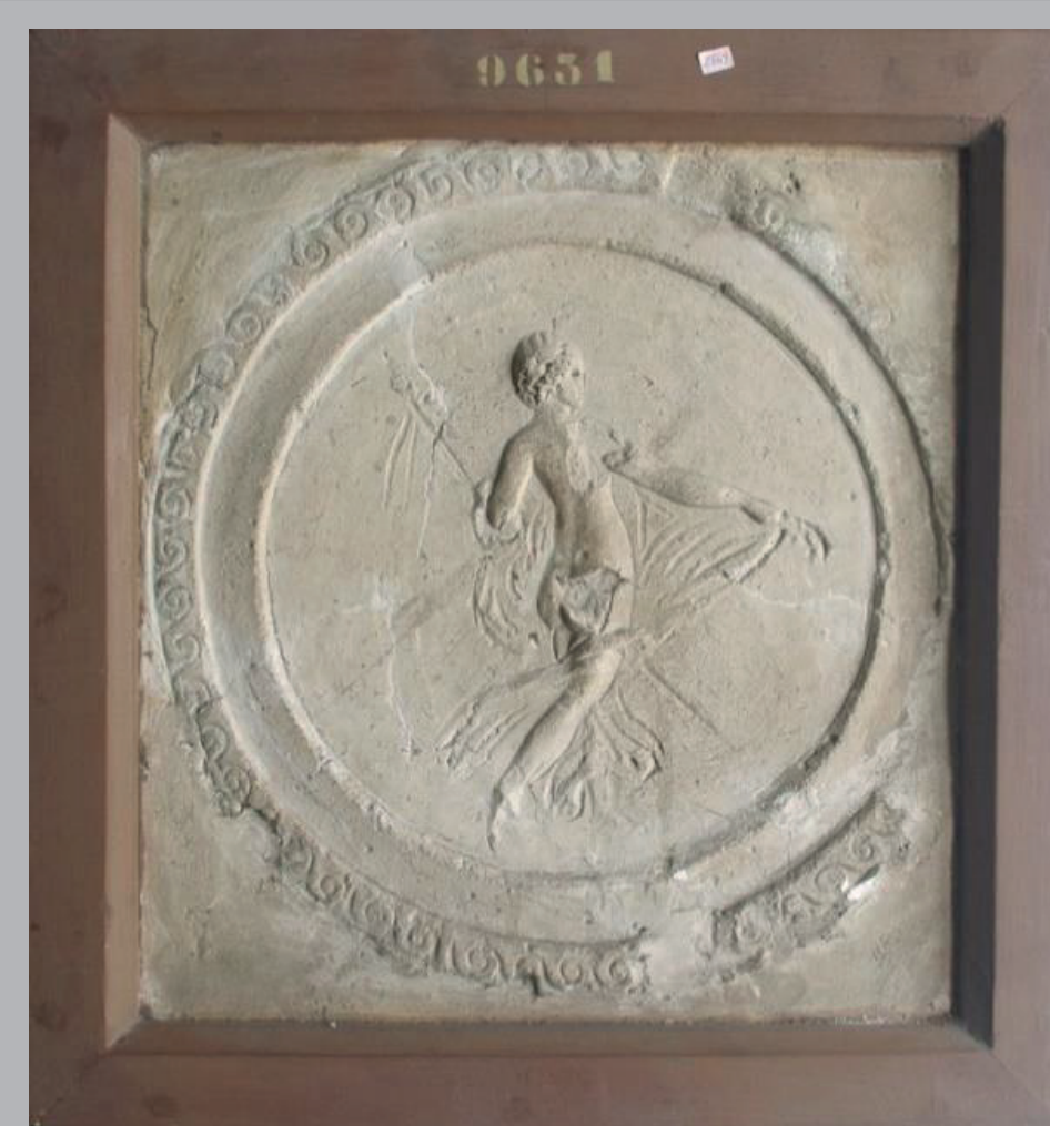
3. Tre rilievi conservati nei depositi del MANN. Da sinistra a destra: combattimento tra pigmei e gru, n° inv. 9629; putto su pistrice, n° inv. 9626; figura muliebre danzante, n° inv. 9631.

Lo studio preliminare della collezione del MANN (29 stucchi), per lo più inedito, presenta già dei punti di gran interesse per la tecnica e la stilistica di questa produzione artistica post-pompeiana, che rimane, tuttora, mal documentata. Per esempio, l'osservazione del materiale ha permesso di mettere in evidenza l'utilizzo di un fondo blu su alcuni stucchi ma anche di precisare o correggere le descrizioni iconografiche.