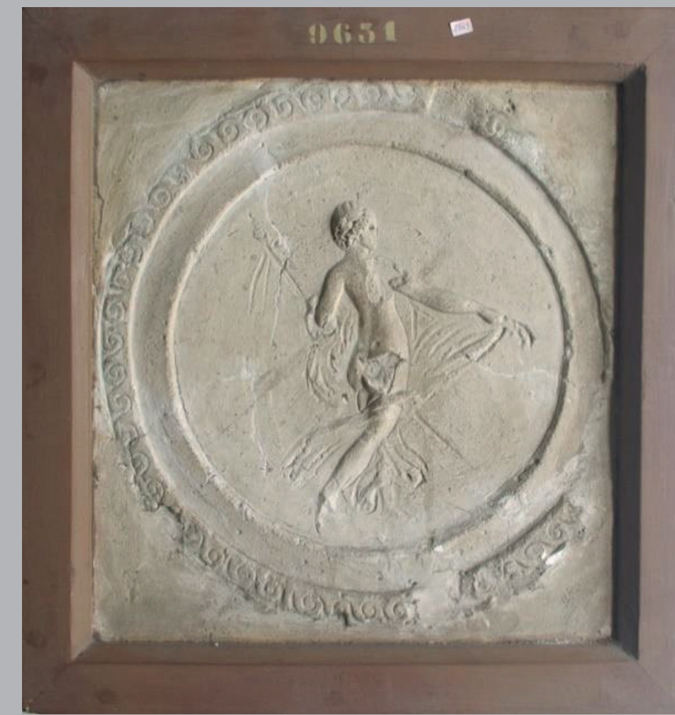
3. Tre rilievi conservati nei depositi del MANN. Da sinistra a destra: combattimento tra pigmei e gru, n° inv. 9629; putto su pistrice, n° inv. 9626; figura muliebre danzante, n° inv. 9631.

Lo studio preliminare della collezione del MANN (29 stucchi), per lo più inedito, presenta già dei punti di gran interesse per la tecnica e la stilistica di questa produzione artistica post-pompeiana, che rimane, tuttora, mal documentata. Per esempio, l'osservazione del materiale ha permesso di mettere in evidenza l'utilizzo di un fondo blu su alcuni stucchi ma anche di precisare o correggere le descrizioni iconografiche.