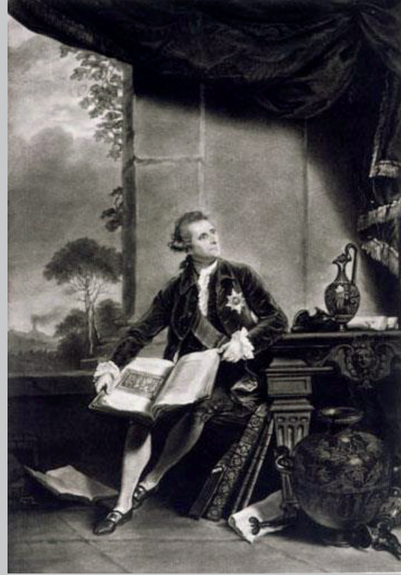
1. Interno di un colombarium , zona di San Vito (G.-B. Natali, in Paoli 1768, pl. XXXII); 2. Lord Hamilton ritratto da Henry Hudson, 1787 (Wikipedia).