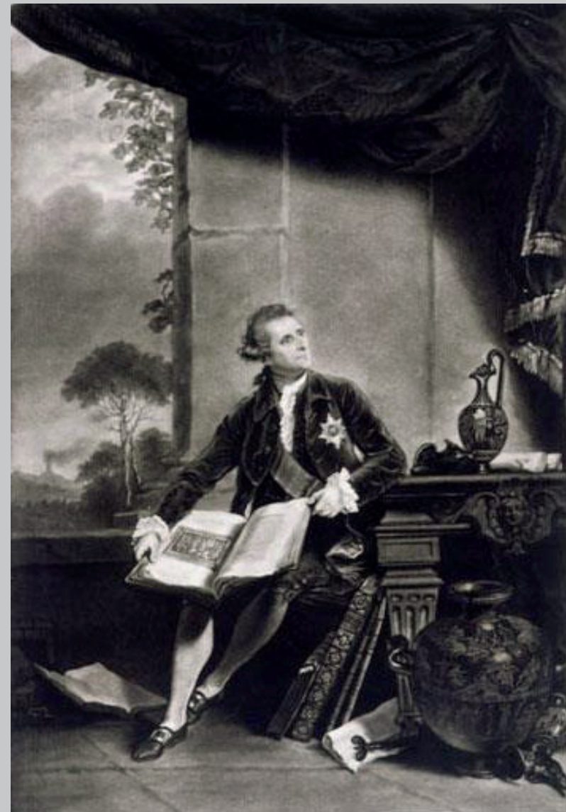
1. Interno di un colombarium , zona di San Vito (G.-B. Natali, in Paoli 1768, pl. XXXII); 2. Lord Hamilton ritratto da Henry Hudson, 1787 (Wikipedia).