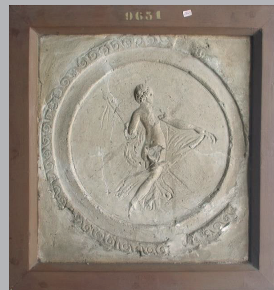
3. Tre rilievi conservati nei depositi del MANN. Da sinistra a destra: combattimento tra pigmei e gru, n° inv. 9629; putto su pistrice, n° inv. 9626; figura muliebre danzante, n° inv. 9631.

Lo studio preliminare della collezione del MANN (29 stucchi), per lo più inedito, presenta già dei punti di gran interesse per la tecnica e la stilistica di questa produzione artistica post-pompeiana, che rimane, tuttora, mal documentata. Per esempio, l'osservazione del materiale ha permesso di mettere in evidenza l'utilizzo di un fondo blu su alcuni stucchi ma anche di precisare o correggere le descrizioni iconografiche.