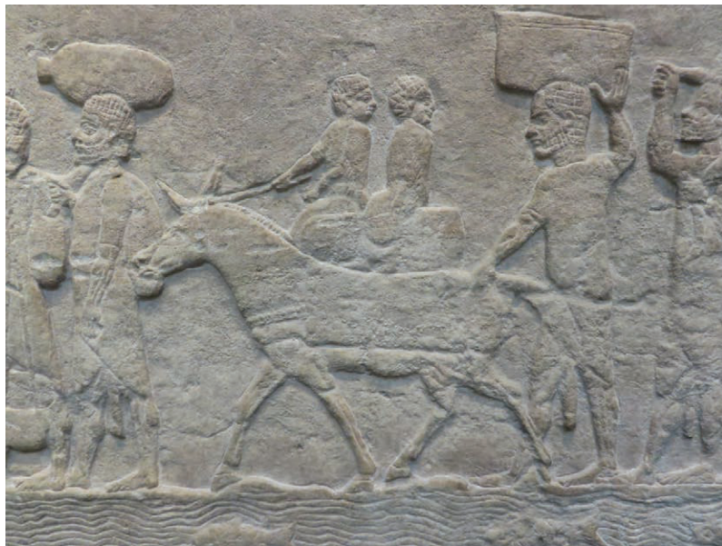
22. Détail, pièce M, palais nord, vers 645-635 av. n. è., Ninive, Assurbanipal. Inv. 124928, British Museum.

L’âne est associé à la représentation de lourdes charges, mais aussi aux figures de la femme et de l’enfant. Il suit docilement la marche. Simplement maintenu par une longe et guidé par un individu muni d’un bâton, l’animal peut être harnaché à joug d’encolure à un char ou encore