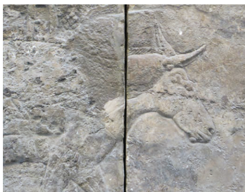
23. Détail, pièce XXVIII, palais nord, 705-681 av. n. è., Ninive, Sennachérib. Inv. 124953-124954, British Museum.