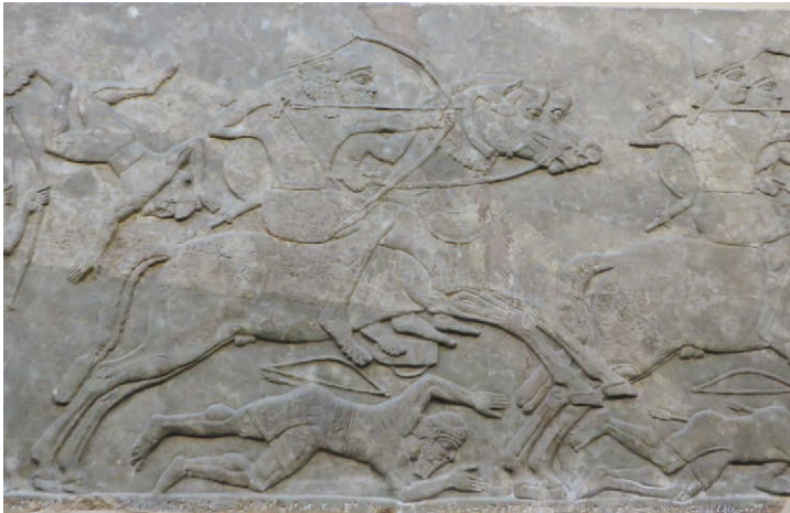
16. Détail, pièce B, palais nord-ouest, vers 865-860 av. n. è., Nimrud, Assurnasirpal I. Inv. 124544, British Museum.