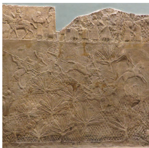
21. Détail, pièce M, palais nord, 700-692 av. n. è., Ninive, Sennachérib. Inv. 124952, British Museum.

du motif conique favorise la compréhension et donne des clés de lecture au spectateur 30 , mais l'évolution de la position des protagonistes sur ce décor illustre quant à elle la singularité de chaque règne. Enfin, ce motif fait office de témoin de la réalité des déplacements de l'armée, laquelle, pour satisfaire les volontés toujours plus expansionnistes de ses rois, se voit contrainte de traverser des routes difficiles.