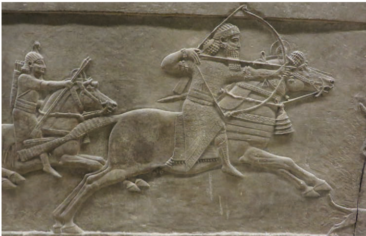
17. Détail, pièce S, palais nord, vers 645-635 av. n. è., Ninive, Assurbanipal. Inv. 124876, British Museum.