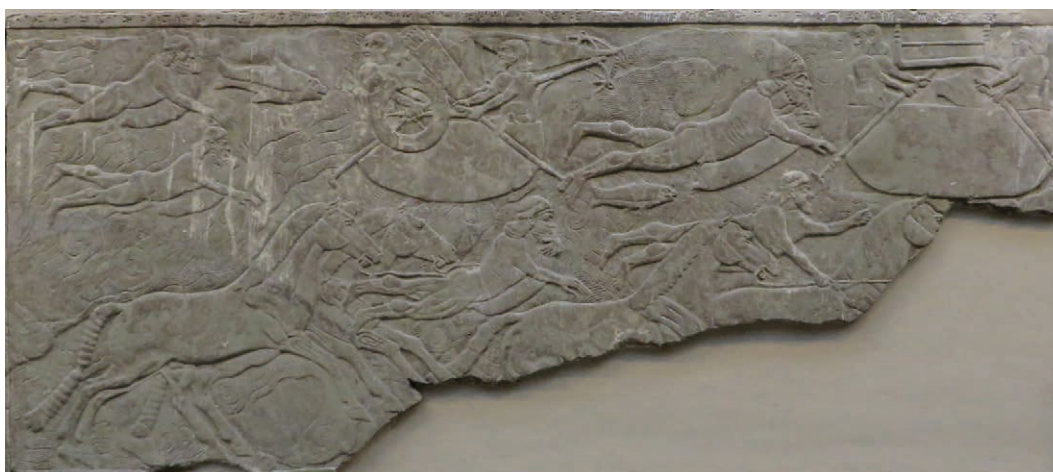
19. Relief, pièce B, palais nord-ouest, 865-860 av. n. è., Ninive, Assurnasirpal II. Inv. 124543, British Museum.