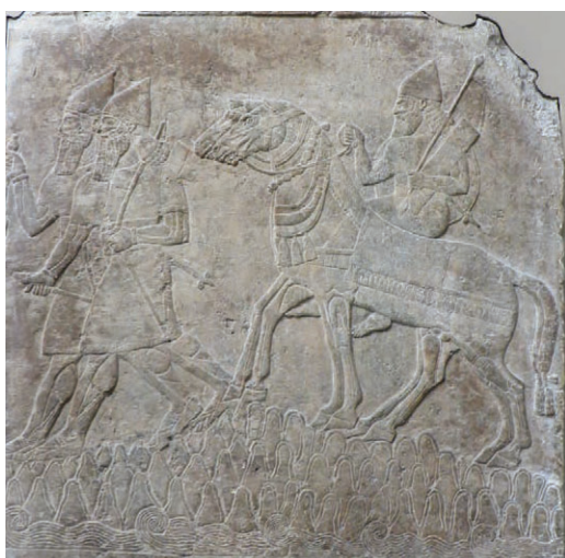
20. Relief, pièce WG, palais nord-ouest, vers 874 av. n. è., Nimrud, Assurnasirpal II. Inv. 124558, British Museum.