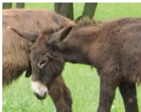
24. Tête d'âne, St Goarshausen.

(fig. 25), issu du palais d'Assurbanipal à Ninive, exprime avec force sa réticence. Deux hommes tentent de le harnacher au char royal, tandis qu'il se débat et se dresse sur les pinces 35 . L'animal ouvre largement la bouche, place ses oreilles à l'arrière de sa tête, a les sourcils froncés et les yeux exorbités. Cette image traduit avec précision le refus de l'animal et sa panique. Elle peut être comparée à des photographies (fig. 26) de chevaux actuels observés lors d'une séance – peu agréable pour l'animal – d'étiopathie 36 . Les manipulations effectuées par le thérapeute sur le cheval peuvent générer chez lui de l'angoisse face à un individu peu connu voire inconnu, mais aussi des douleurs de courte durée. La séance en elle-même présente pour l'animal un contexte inhabituel propice à l'expression d'émotions négatives telles que le stress. Les photographies de cette séance montrent un animal ouvrant largement la bouche, élargissant les naseaux, tendant le cou dans un mouvement de recul et de dégagement. Maintenu par un filet, il ne peut toutefois