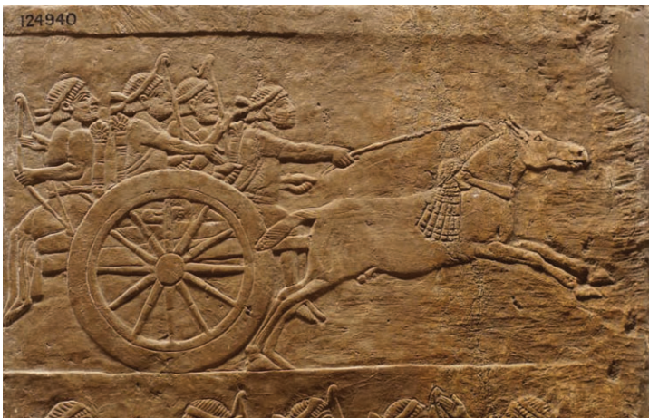
18. Détail, pièce H, palais nord, 645-635 av. n. è., Ninive, Assurbanipal. Inv. 124940, British Museum.