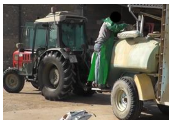
Fig. 1. Phase de remplissage.

Au cours de cette phase, des ports de charge répétés sont évalués par les opérateurs, chaque sac de produits phytopharmaceutiques pouvant aller de 2,5kg jusqu'à 25 kg. De plus, l'importance des doses homologuées sur certains produits entraînent une charge totale importante. Comme par exemple, lors de l'usage de soufre, qui est homologué pour un dosage de 12,5kg/ha.