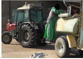
Fig. 1. Phase de remplissage.

Au cours de cette phase, des ports de charge répétés sont évalués par les opérateurs, chaque sac de produits phytopharmaceutiques pouvant aller de 2,5kg jusqu'à 25 kg. De plus, l'importance des doses homologuées sur certains produits entraînent une charge totale importante. Comme par exemple, lors de l'usage de soufre, qui est homologué pour un dosage de 12,5kg/ha.