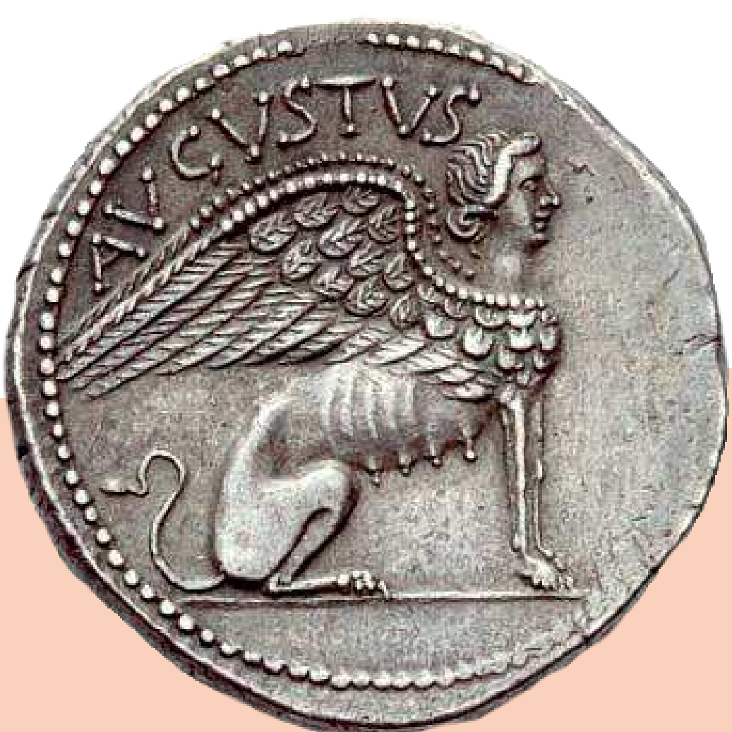
Revers d'une monnaie romaine représentant un sphinx