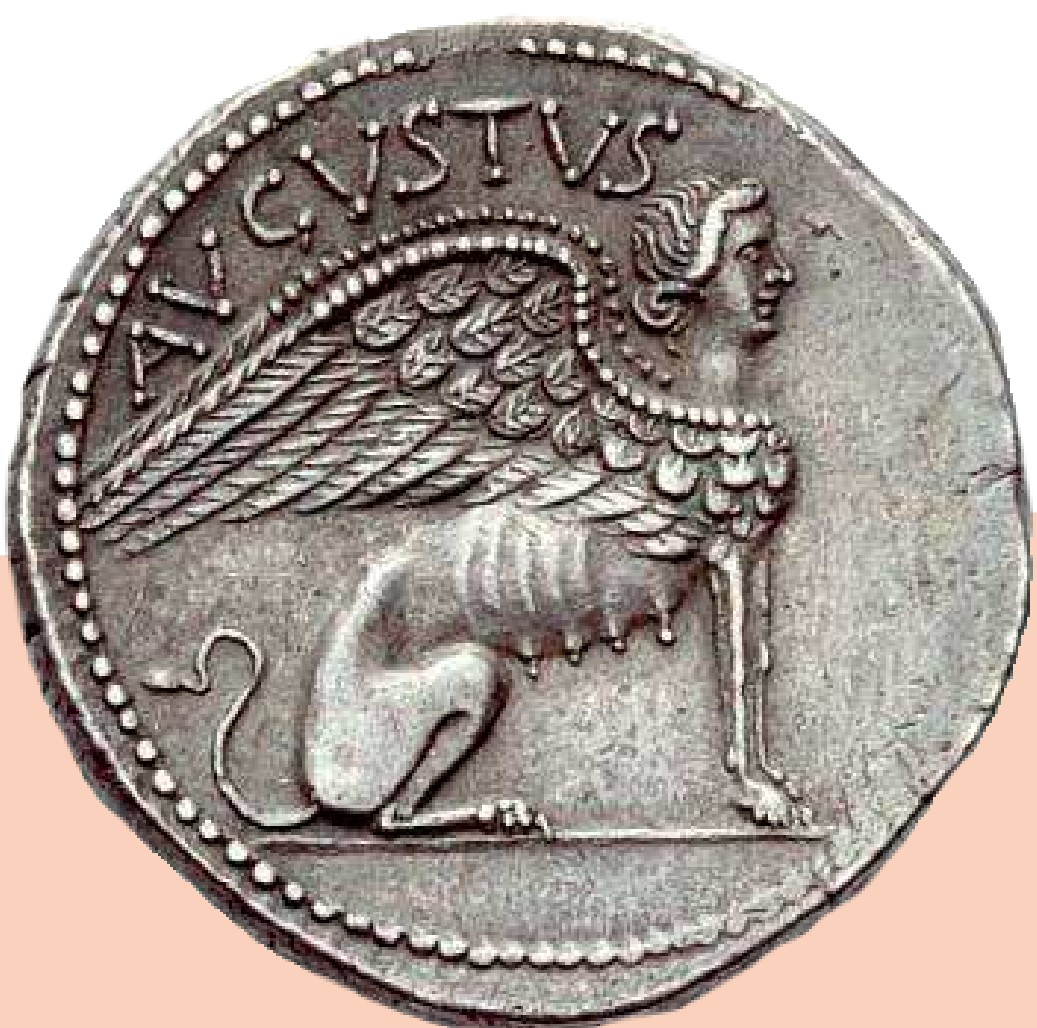
Revers d'une monnaie romaine représentant un sphinx