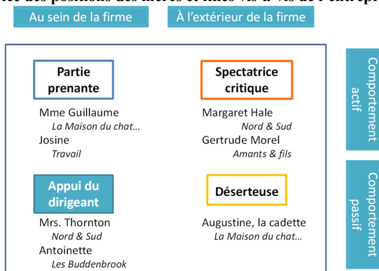
Figure 1 – Matrice des positions des mères et filles vis-à-vis de l'entreprise

Cette illustration détaille les positions occupées par la gente féminine en les éclairant d'un à deux exemples particulièrement typiques. Selon leur proximité à l'affaire familiale, il est possible de distinguer celles qui ont une place au sein de la firme (ne serait-ce par l'apport de fonds) et celles qui lui restent extérieures. Cette matrice permet par ailleurs d'isoler les femmes qui tendent à adopter un comportement actif (dans l'acception de la sociologie des organisations, au sens où elles vont chercher à défendre leurs positions ou leurs points de vue) de celles qui cherchent plutôt à se dérober aux enjeux d'autrui, le plus souvent leur famille.