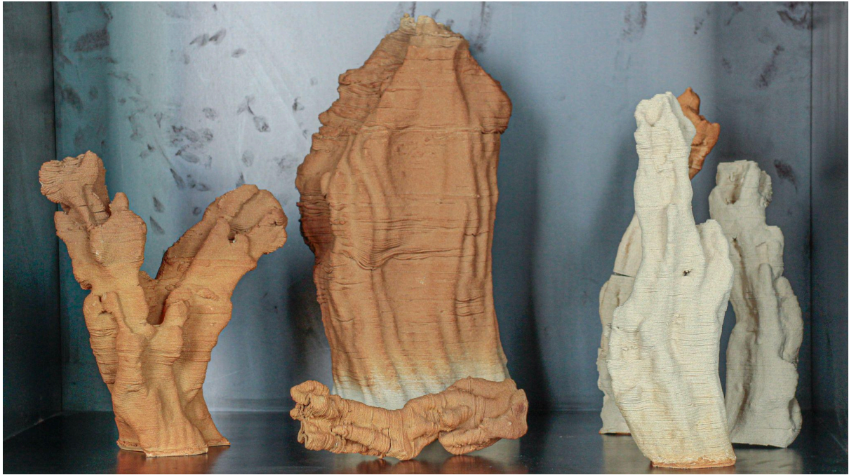
Elise Rigot & Guillaume Barbareau Fragment corallien - Série Corallium rubrum Juillet 2021, Impression 3D, Grès Pièce réalisée aux Ateliers du Faire de la fondation d'entreprise Martell