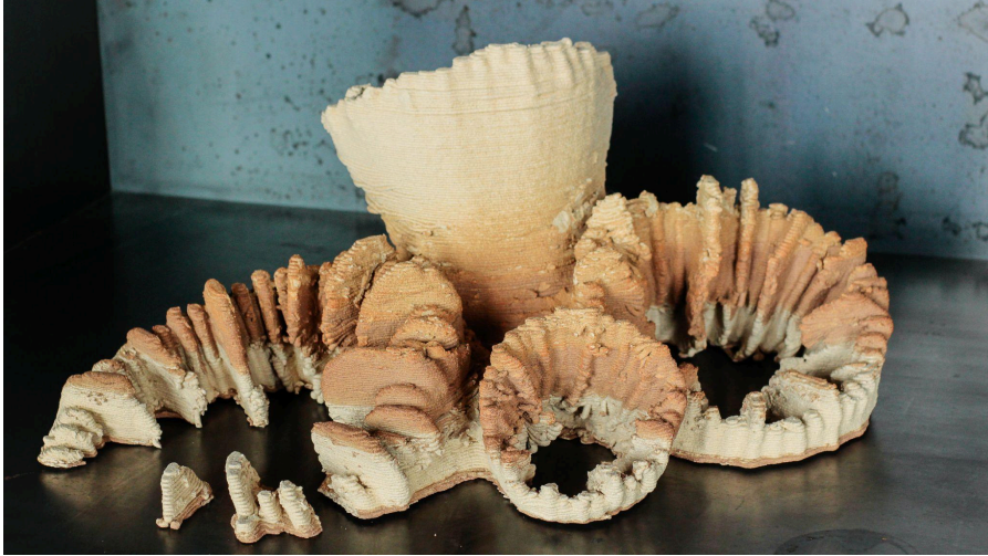
Elise Rigot & Guillaume Barbareau Fragment corallien - Caryophyllia clavus n°1 Mai 2021, Impression 3D, Grès Pièce réalisée aux Ateliers du Faire de la fondation d'entreprise Martell