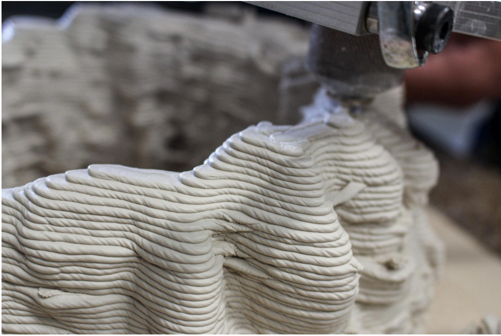
Elise Rigot & Guillaume Barbareau Sculpture en cours d'impression Fragment corallien - Cyphastrea micropthalma n°3 Juillet 2021, Impression 3D, Porcelaine Ateliers du Faire de la fondation d'entreprise Martell