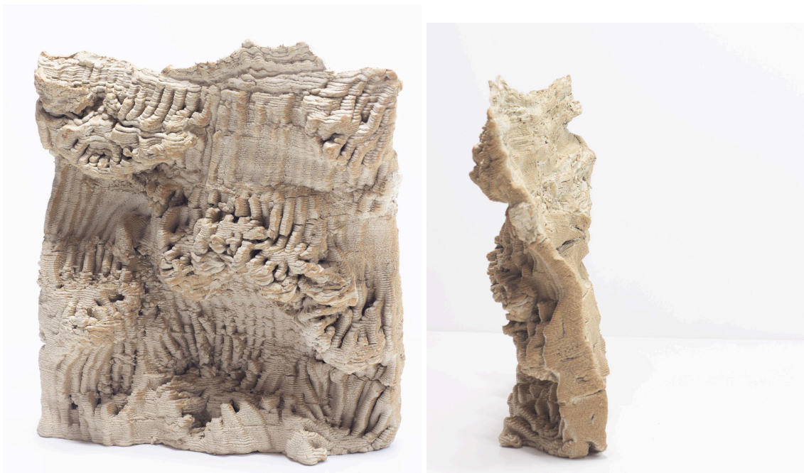
Elise Rigot & Guillaume Barbareau Fragment corallien - Mycédium okeni n°1 Mai 2021, Impression 3D, Grès Pièce réalisée au 8Fablab de Crest