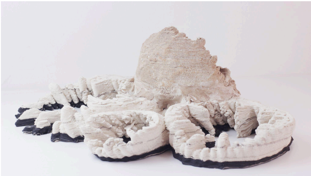
Elise Rigot & Guillaume Barbareau Fragment corallien - Caryophyllia clavus n°1 Mai 2021, Impression 3D, Grès Pièce réalisée au 8Fablab de Crest