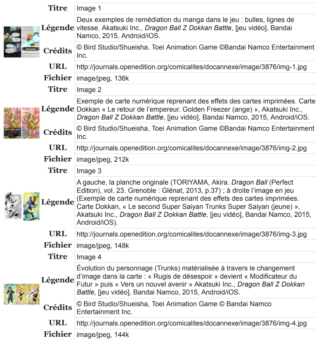
Table des illustrations

29 Certes, il est toujours possible d'acheter les volumes de Dragon Ball en noir et blanc et dans l'ordre initial de création. Néanmoins, cette nouvelle réédition de la série montre bien que la logique d'exploitation des adaptations (télévisées et vidéoludiques) l'emporte sur celle du manga initial.