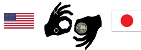
図 1: Example of Iconic Gesture

話によって縁取られる。同じ手の形でも、英字の O と K を参照したり、日本では 3 本の指で強調されたコインを参照し、「お金がたくさんある」ことを意味することがある。