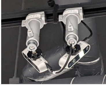
図 3: Ceiling mounted Intel RealSense Cameras

や、自然な手の動きを妨げるコントローラーによって制限されている。一方、IoT/AI ラボにはプロジェクション