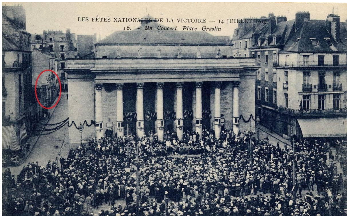
L'Elysée-Graslin (cerclé de rouge), rue Corneille, 14 juillet 1910, carte postale, AMN 9Fi11

Les préventions des hommes politiques envers le café-concert tiennent aussi à son absence de moralité. En 1872, le ministre de l'instruction publique et des beaux-arts, Jules Simon, attaque le café-concert à plusieurs reprises. Ses propos sont publiés et commentés par le Phare de la Loire , en particulier une lettre au directeur du Conservatoire de Paris. Le ministre y condamne tant la musique que les paroles : « La lubricité et la sottise des paroles servent de véhicule à des airs qui ne sont ni moins plats, ni moins sots » (18 septembre 1872).