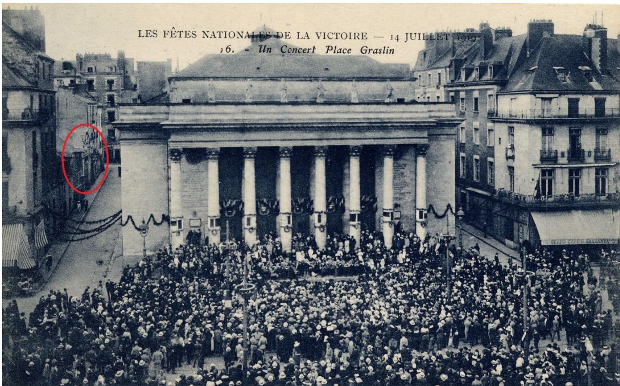
L'Elysée-Graslin (cerclé de rouge), rue Corneille, 14 juillet 1910, carte postale, AMN 9Fi11

Les préventions des hommes politiques envers le café-concert tiennent aussi à son absence de moralité. En 1872, le ministre de l'instruction publique et des beaux-arts, Jules Simon, attaque le café-concert à plusieurs reprises. Ses propos sont publiés et commentés par le Phare de la Loire , en particulier une lettre au directeur du Conservatoire de Paris. Le ministre y condamne tant la musique que les paroles : « La lubricité et la sottise des paroles servent de véhicule à des airs qui ne sont ni moins plats, ni moins sots » (18 septembre 1872).