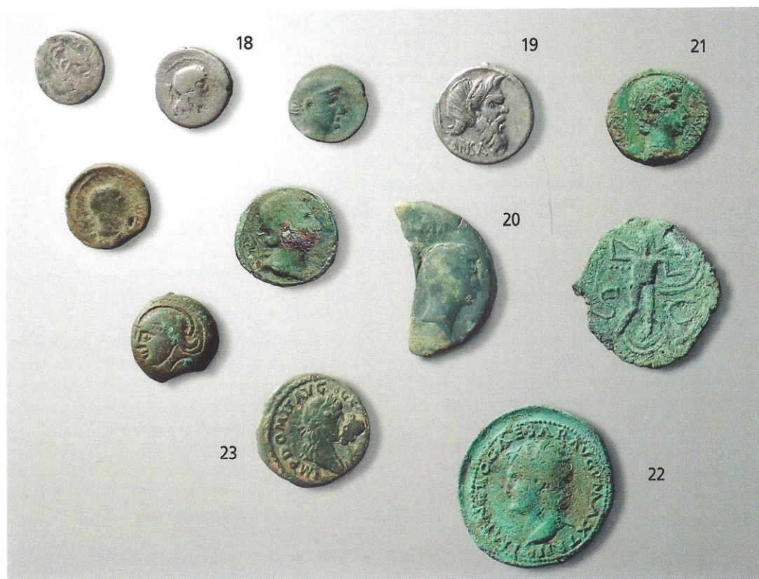
Figure 36 : Aperçu de la petite monnaie en circulation sur la villa de Noyon

Bibliographie : Type Dressel 2/4 ; pour la provenance, Los 2000 : 256-258