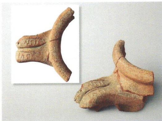
Figure 35 : Amphore vinaire estampillée (n°16)