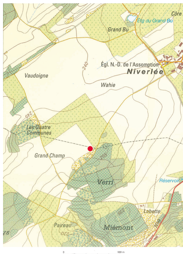
Fig. 1. Localisation du site sur un extrait de la carte 1:10000 de l'IGN 58/2.