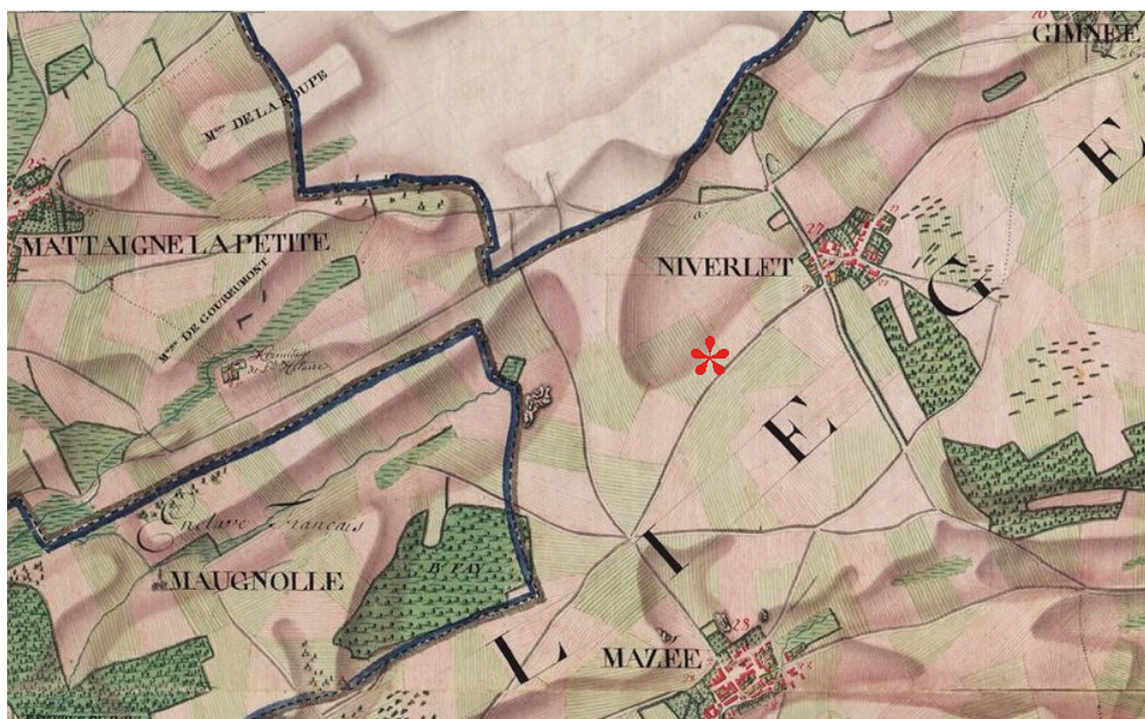
Fig. 2. Localisation du site sur un extrait de la Carte de cabinet des Pays-Bas autrichiens dressée entre 1771 et 1778 par le Comte de Ferraris.

Hilaire, à 2,2 km (Doyen 2012-2013), et surtout la villa de Treignes, à environ 3 km à vol d'oiseau (Cattelain 2014).