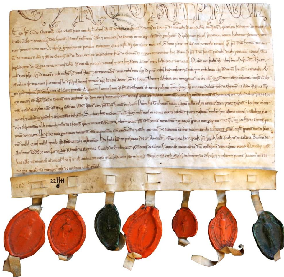
11. AD Aube, 22 H 11, n° 6 - Moitié de chirographe scellé du fonds de Trois-Fontaines (arbitrage entre les abbayes de Trois-Fontaines et de Cheminon, au sujet de la propriété de deux pièces de bois, rendu en 1203 par l'abbé de Clairvaux avec le conseil des abbés de La Chalade, de Haute-Fontaine, de Montier-en-Argonne, de Larrivour, de Boulancourt et de Chéhéry)