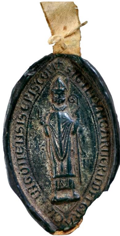
17. Empreinte détachée de Garnier II de Rochefort, évêque de Langres, avant nettoyage des traces de plâtre résultant du moulage par A. Coulon (AD Aube, 42 Fi 153)

L'abbaye de Trois-Fontaines (Marne, commune Trois-Fontaines-l'Abbaye), première fille de Clairvaux, fut fondée en 1118 dans le diocèse de Châlons à l'initiative de l'évêque Guillaume de Champeaux (1113-1121) et du comte de Champagne Hugues I er (1093-1125). Modestes au début, les donations des seigneurs des environs affluent à partir de 1146 et le patrimoine se diversifie en même temps qu'il s'étend vers l'est (terres et pâturages, étangs, moulins, granges, salines à Vic-sur-Seille, forge à Wassy et maisons à Reims, Saint-Dizier, Vitry, Verdun et Châlons). Pour tous ces domaines, l'abbaye bénéficie de la protection de l'empereur, des comtes de Champagne et des comtes de Bar 60 . La filiation de Trois-Fontaines, qui comptera jusqu'à dix établissements, s'étend en Hongrie (Saint-Gothard) et en Croatie (Bélakut). Les archives de l'abbaye, dans un excellent état de conservation, témoignent de cette histoire et du soin qui leur fut apporté. Ainsi, sur un total de 654 actes originaux du Moyen Âge, le chartrier actuel comporte encore 21 bulles pontificales et 316 sceaux de cire (tableau 3), soit un taux de conservation considérable de plus de 45 % 61 .