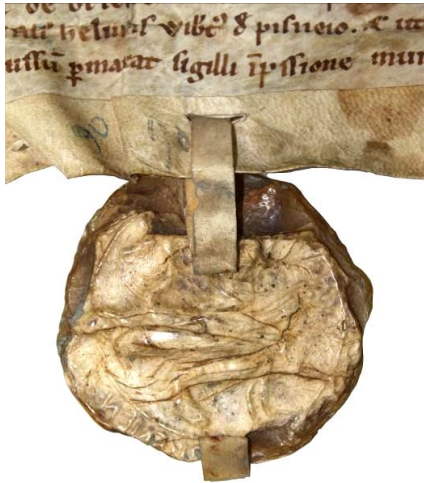
Sceau de Jacques de Pont, maire de Bar-sur-Aube (milieu du XIII e siècle) : 18. Empreinte détachée (AD Aube, 42 Fi 91) - © Noël Mazières – 19. Moulage (AN, Sc/Ch/33) - © Clément Blanc-Riehl.