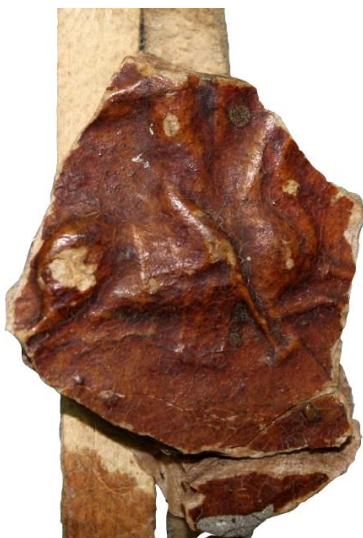
Sceau de Gautier II, comte de Brienne [v. 1125-1161] : 20. Empreinte (AD Aube, 27 H 3) - – 21. Moulage (AN, Sc/Ch/49) -.