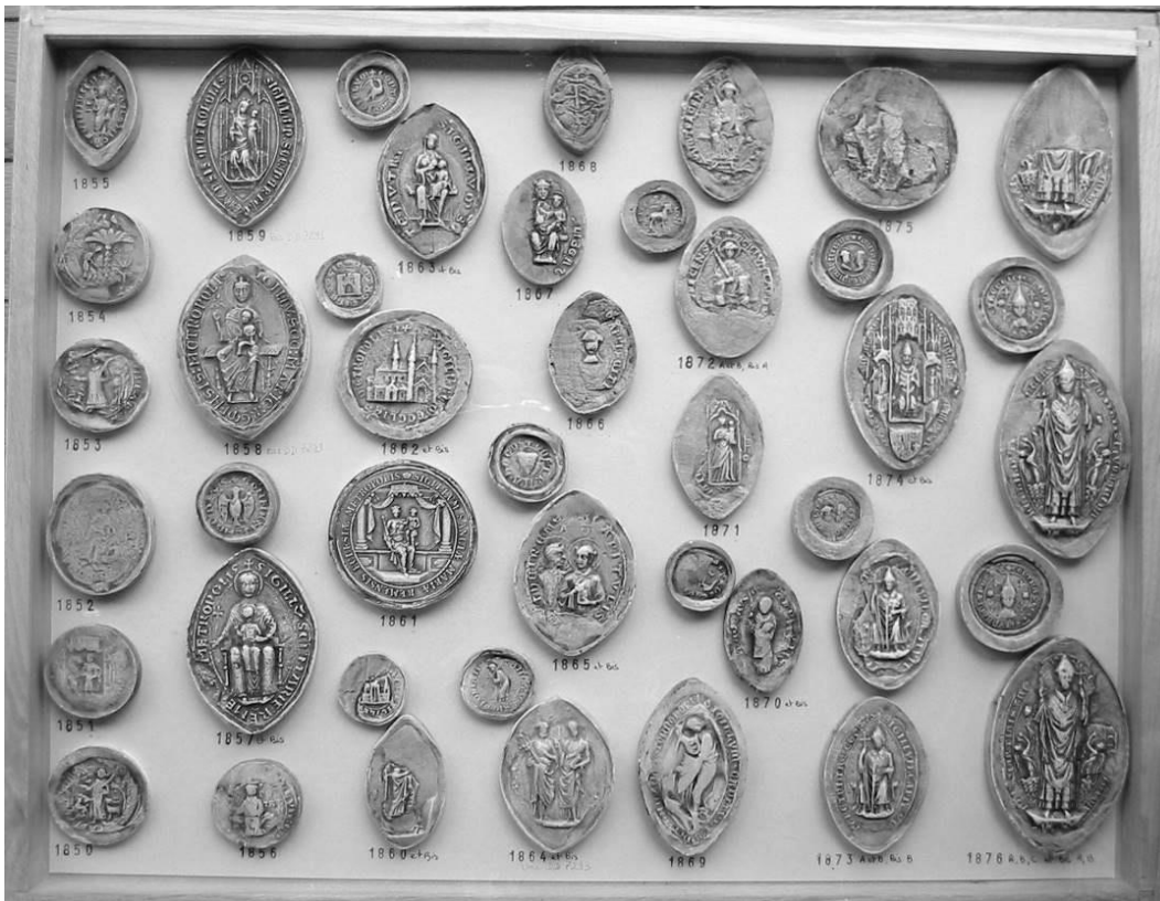
2. Collection des sceaux de Champagne aux Archives nationales : un plateau de moulages