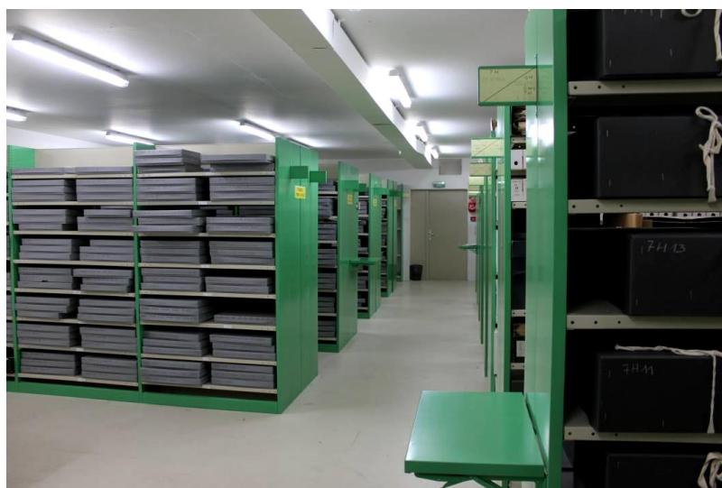
6. Conditionnement du fonds du prieuré de Foissy (AD Aube, 27 H 3)