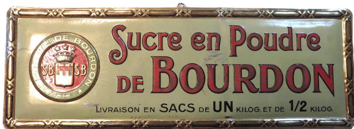
Figure 4 – Plaque publicitaire sur métal

0041, 0159). Tout un mobilier consacré à la mise en valeur des produits se développe, comme les sucriers (SB-0024), les coupes (SB-0022, 0032, 0037), bocaux (SB-0051-0053) ou ampoules de présentation (SB-0057), alors que les arts décoratifs acquièrent un nouveau statut social. Les plaques publicitaires en métal font leur apparition, et Bourdon en fait réaliser par l'imprimeur-lithographe Ferdinand Champenois (1842-1915) (SB-0010), un des pionniers de cette technique et l'un des principaux imprimeurs de l'art nouveau 28 (figure 4).