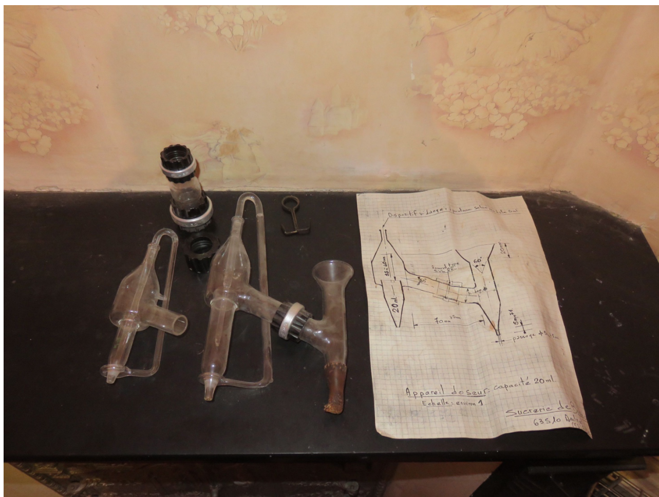
Figure 3 – Appareil doseur [prototype et schéma, sur site].

© Coll. Clermont Auvergne Métropole, SB-0080, 1983.