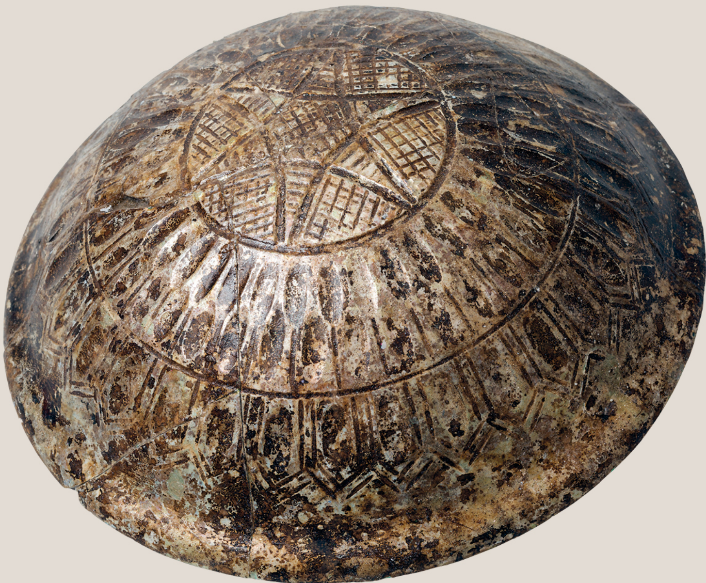
Coupe en verre gravée de la tombe I.146