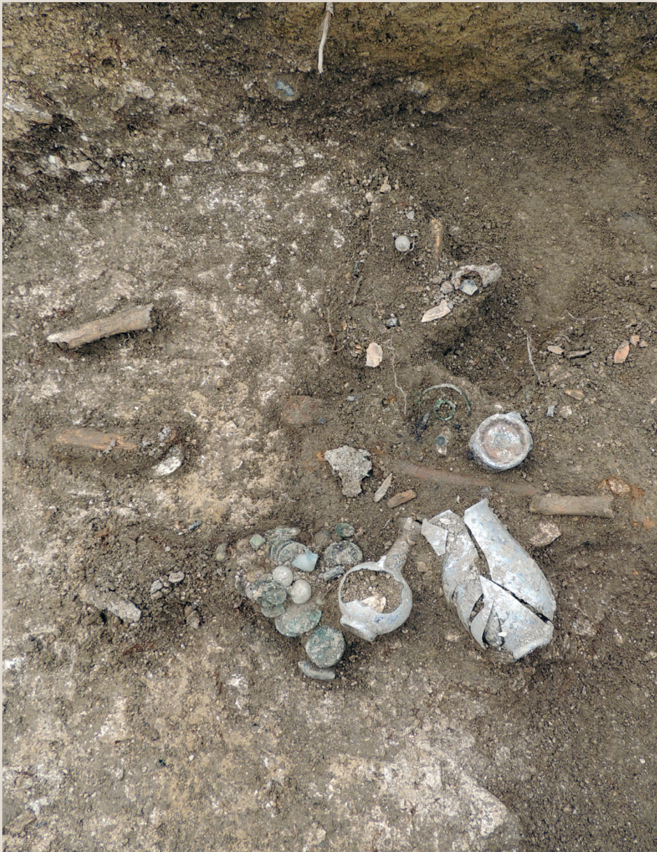
La bourse de la tombe 148 : 29 monnaies frappées entre 103 et 278 apr. J.-C., déposées le long de la jambe gauche d'un enfant.