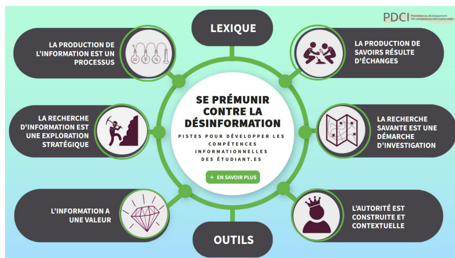
Figure 2. Accueil - Se prémunir contre la désinformation, les six fondements

Si ces sujets concernent tous les étudiants, ils concernent encore plus les étudiants qui se destinent à travailler dans les domaines de l'information et des bibliothèques.