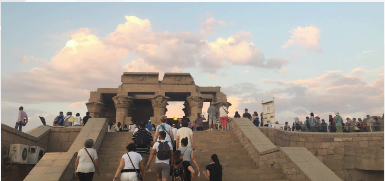
Fig.1 : Vue du temple depuis l'entrée

Résumé : Au cœur d'enjeux économiques importants, l'exploitation et l'utilisation moderne des sites archéologiques prennent souvent le pas sur leur étude. Le temple de KomOmbo, situé le long du parcours des croisières sur le Nil, est l'une des étapes incontournables pour des milliers de touristes. Il est donc directement concerné par les problématiques d'usure, d'entretien et de conservation des structures qui dépassent souvent le cadre défini par la Charte de Venise. Il est ainsi urgent de procéder à l'analyse de cette catégorie de bâtiment, afin de permettre leur sauvegarde scientifique. Les humanités numériques sont au cœur de la recherche actuelle en sciences humaines et offrent de nouvelles perspectives pour la documentation et l'inventaire des ressources, le développement de méthodes et d'outils, ainsi que pour la diffusion et le partage des données.