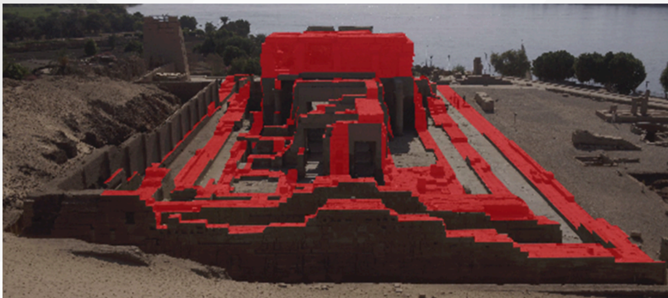
Fig. 2 : Vue depuis l'est des structures arasées en rouge

Le temple, dédié aux dieux Sobek et Haroéris et à leurs divinités associées, est installé sur un plateau, bordé de deux bras du Nil, responsables de l'effondrement majeur des bâtiments du sanctuaire. Le temple actuel semble avoir été bâti en plusieurs phases datées du règne de Ptolémée VI Philométor (186-145 av. J.-C.) à la période romaine (30 av. J.-C. -391 ap. J.-C.). Il est le seul, parmi les cinq plus grands temples gréco-romains construits sur le sol égyptien, à n'avoir bénéficié ni de relevés, n'y d'analyses architecturales et archéologiques modernes 1 . L'étude de cet édifice tire parti du fait que sa structure a été partiellement endommagée, ce qui permet d'accéder à des informations sur les techniques de construction que l'on n'aurait pas pu observer autrement (Fig. 2). Elle s'inscrit ainsi dans une série de recherche sur la construction des espaces cultuels dans l'Égypte gréco-romaine qui ont été menées ces dernières années par plusieurs scientifiques (1-5).