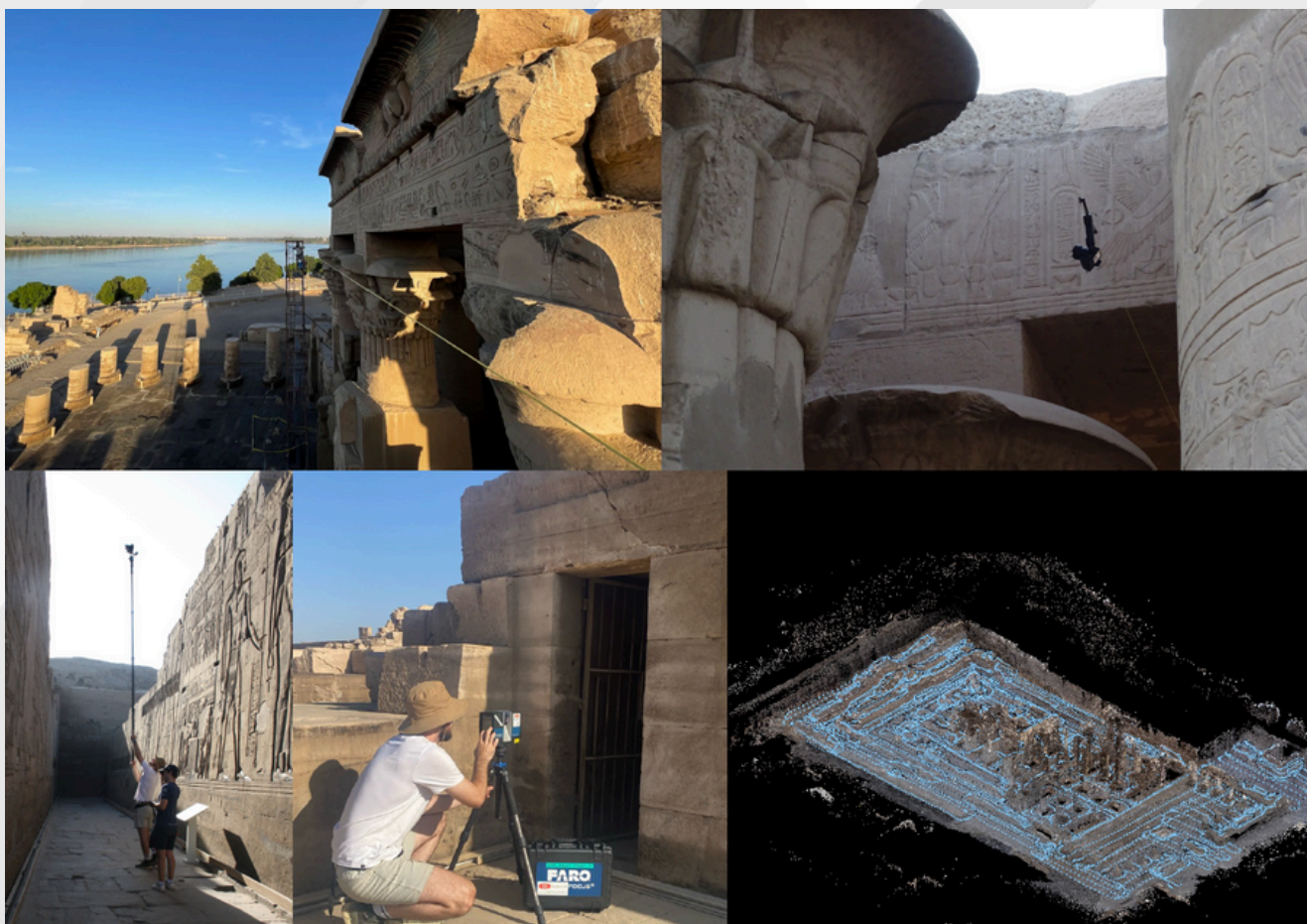
Fig. 3 : Relevé photographique avec tyrolienne et perche, laser scanner et étape d'alignement des clichés sur Metashape

Une grille de 5x5 mètre a ensuite été appliquée à l'ensemble de l'édifice en nommant chaque tuiles obtenue par une lettre (axe de l'ordonnée) et un chiffre (axe de l'abscisse) correspondant à une position géoréférencée dans l'ensemble (Fig. 4).