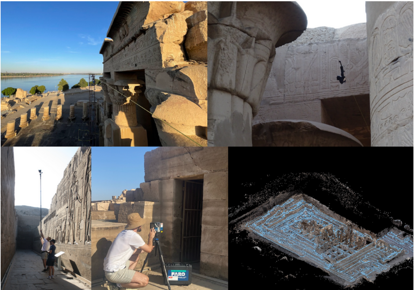
Fig. 3 : Relevé photographique avec tyrolienne et perche, laser scanner et étape d'alignement des clichés sur Metashape

Une grille de 5x5 mètre a ensuite été appliquée à l'ensemble de l'édifice en nommant chaque tuiles obtenue par une lettre (axe de l'ordonnée) et un chiffre (axe de l'abscisse) correspondant à une position géoréférencée dans l'ensemble (Fig. 4). Des orthophotographies ont ainsi été exportées en haute qualité de 12k x 12k pixels par tuile de 6 x 6 m, soit une précision de 1px/0,5mm, tout en laissant un débord de 50 cm de chaque côté pour gérer le recouvrement des dessins. La vectorisation du plan est ensuite réalisée sur le terrain, face aux vestiges, par des dessinatrices 3 qui utilisent le canevas offert par ses images dans l'application vectorielle Curvè 4 , sur tablette.