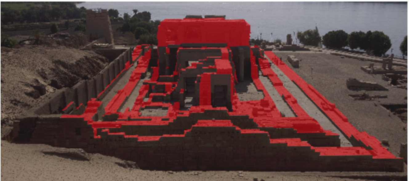
Fig. 2 : Vue depuis l'est des structures arasées en rouge

Le temple, dédié aux dieux Sobek et Haroéris et à leurs divinités associées, est installé sur un plateau, bordé de deux bras du Nil, responsables de l'effondrement majeur des bâtiments du sanctuaire. Le temple actuel semble avoir été bâti en plusieurs phases datées du règne de Ptolémée VI Philométor (186-145 av. J.-C.) à la période romaine (30 av. J.-C. -391 ap. J.-C.). Il est le seul, parmi les cinq plus grands temples gréco-romains construits sur le sol égyptien, à n'avoir bénéficié ni de relevés, n'y d'analyses architecturales et archéologiques modernes. 1 L'étude de cet édifice tire parti du fait que sa structure a été partiellement endommagée, ce qui permet d'accéder à des informations sur les techniques de construction que l'on n'aurait pas pu observer autrement (Fig. 2). Elle s'inscrit ainsi dans une série de recherche sur la construction des espaces culturels dans l'Égypte gréco-romaine qui ont été menées ces dernières années par plusieurs scientifiques (1–5).