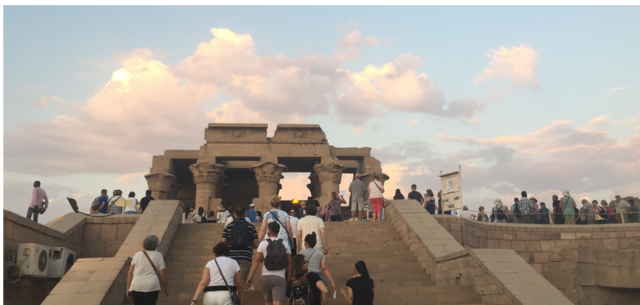
Fig.1 : Vue du temple depuis l'entrée

Résumé : Au cœur d'enjeux économiques importants, l'exploitation et l'utilisation moderne des sites archéologiques prennent souvent le pas sur leur étude. Le temple de KomOmbo, situé le long du parcours des croisières sur le Nil, est l'une des étapes incontournables pour des milliers de touristes. Il est donc directement concerné par les problématiques d'usure, d'entretien et de conservation des structures qui dépassent souvent le cadre défini par la Charte de Venise. Il est ainsi urgent de procéder à l'analyse de cette catégorie de bâtiment, afin de permettre leur sauvegarde scientifique. Les humanités numériques sont au cœur de la recherche actuelle en sciences humaines et offrent de nouvelles perspectives pour la documentation et l'inventaire des ressources, le développement de méthodes et d'outils, ainsi que pour la diffusion et le partage des données.