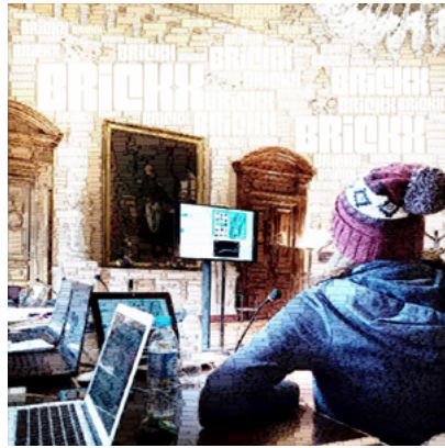
Figura 5: Apresentação do projeto Master 2 2iD, workshop SORODAS, Hôtel de Ville, Salle des Délégations, Chambéry, 2018