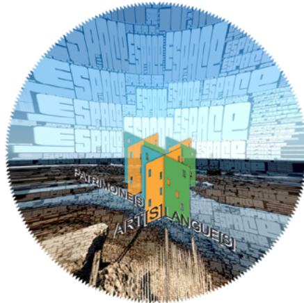
Figura 4: Este i+D/sign (-! information + Design / Sign !-) é o terceiro signo marcador da obra de arte hipermédia SORODAS

estudantes. Este dispositivo, ao aplicar-se num mapa – em três faixas de 90 x 300 cm – expressaria remotamente por uma semana uma soma de dados – uma nova palavra colhida no local – vivida pelos alunos em Mayotte e pelas pessoas entrevistadas, ®-JOGANDO provavelmente (-! pelo menos supomos isso !-) a lacuna cultural, as fragilidades identitárias, enquanto renova uma história comum de desigualdades, de in/visibilização ... 23