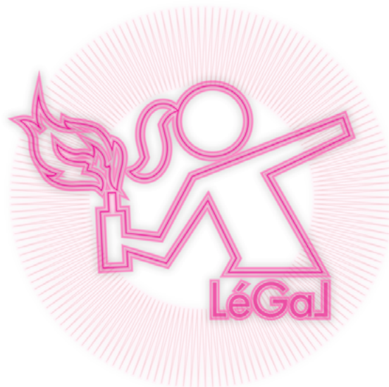
Figura 1: Este i+D/sign (-! information + Design / Sign !-) é um signo marcador da obra de arte hipermédia SORODAS. Preparado para uma possível tatuagem na pele de mulheres piratas

SORODAS; research-creation; digital art; hypermedia; Mayotte