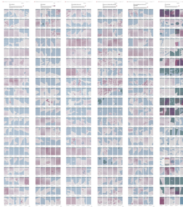
Figure 3: Brandon. Carole. 3 tiras, impressões digitais em papel, 90 x 300 cm, 2018. Esta imagem foi criada para a obra de arte hipermédia SORODAS