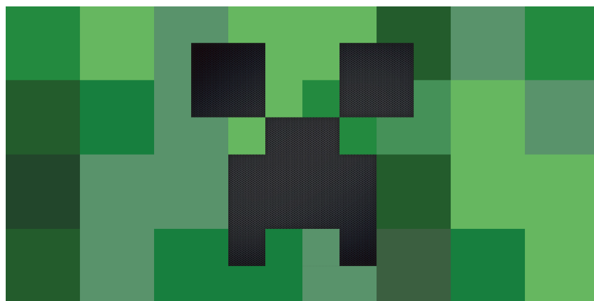
i+D-S_02 : Sociéti i Matériel, T i-REAL-21 château CREEPER, MINECRAFT, 2018

La question de La Fabrique des Histoires , telle qu'elle a été proposée à chacun des intervenants de ce colloque, serait susceptible de ®-ENVOYER ce chacun d'entre Nous paître à la marge des scénarios qui lui suggèrent de ®-PENSER ses relations à une prétendue conscience naturelle ... Comment celle-ci se manifeste en acte ?+) Prend forme dans nos choix, dans notre corps ?+) En somme indique-t-elle le résultat d'une cartographie et sous-entend-t-elle — si il y a lieu — un dispositif de perspective mentale qui distinguerait ce Nous humain / animal de la machine à travers un écart manifeste ?+) Ou plutôt comment pourrait-elle faire pour que JE puisse en prendre conscience ?+) À cet égard, le titre du dernier épisode de cette première saison de Westworld : The Bicameral Mind (-! L'Esprit Bicaméral !-) n'est pas anodin. Est-ce que ce Nous est capable de se diriger in/consciemment sur un territoire ; c'est-à-dire à travers une ®-LECTURE de cette Histoire qui nécessiterait d'abord de notre part une prise de conscience de la mise en ordre, non pas seulement autour d'un concept de ce territoire, mais ®-ACTIVE à cette errance consciente, dans cette construction mentale ?+) Julian Jaynes (-! psychologue à l'origine de cette théorie controversée !-) évoque cette i+M/POSSIBILITÉ à travers L'Iliade : l'homme n'avait pas conscience de sa conscience du monde . 7