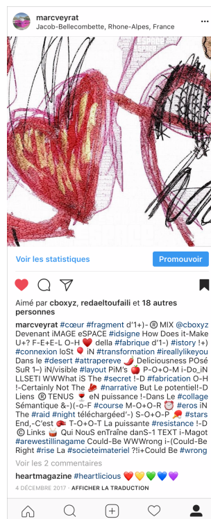
i+D-S_05 : Société i Matériel, Carte i-REAL, i-STORY-04_INSTAGRAM_18-04-02_numéro-00097 @#MAKE tableau Pinterest https://www.pinterest.fr/marcveyrat1/i-real-instagram-i_story/ 2018

Et puis il y a LA carte et LES cartes. Cette provocation de la @-CONNEXION à l'Histoire se fabrique également contre l'IA à travers LES cartes et avec LES cartes contre LE plateau de JE(U)... À ce propos nous pourrions @-LEVER ici des similitudes anthropologiques entre la manière d'éprouver, de @-LIRE La Colonne Détruite comme d'aborder physiquement, rencontrer ce lieu abstrait de LA carte ?+) Car, dans le Désert de Retz, cette fausse ruine en forme de colonne tronquée nous suggère immédiatement, par sa présence, sa taille et son i+M/COMPLÉTUDE, un au-delà du paysage @-PRÉSENTÉ.