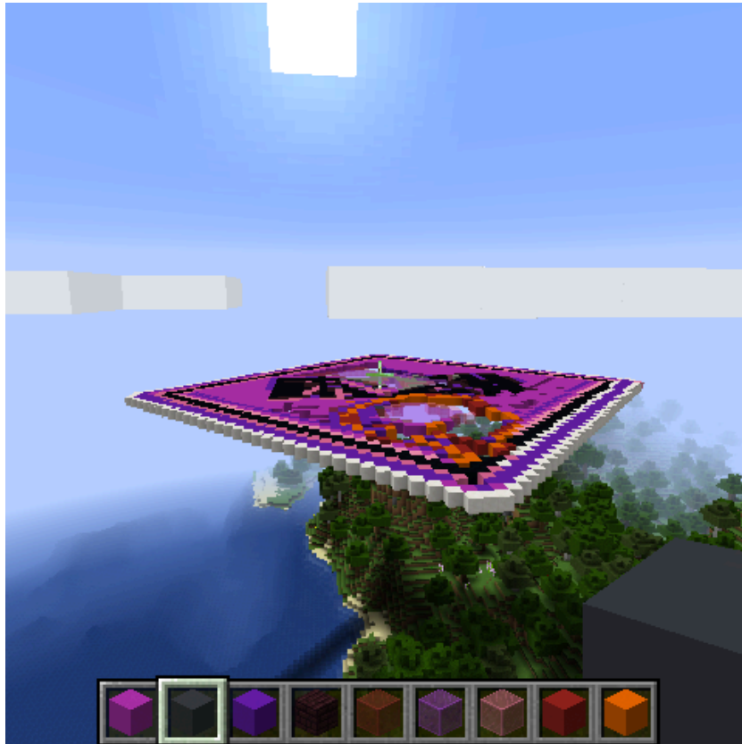
i+D-S_07 : Société i Matériel, i-REAL MINECRAFT, 2018 Peter Meetgrinder | i-REAL & la Carte Les Fabriques des Histoires https://youtu.be/KXTTfkU3DY

“La mémoire n’est qu’une collection choisie d’excitations auxquelles répondent des manifestations (à voix haute ou à voix basse). [...] La question est de savoir comment naissent les expressions phonétiques ou figurées, selon quel sentiment ou quel point de vue, conscient ou inconscient, elles sont conservées dans les archives de la mémoire, et si il existe des lois selon lesquelles elles s’y déposent et émergent à nouveau”. 29 Roland Recht, citant Aby Warburg, in L’Atlas Mnémosyne d’Aby Warburg , in Aby Warburg, L’Atlas Mnémosyne , Éditions L’Écarquillé, Paris, 2012, p.12