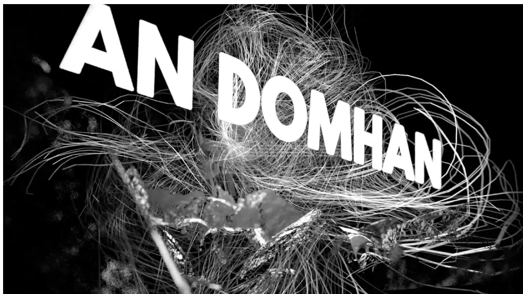
An Domhan, 2021 @ Gaëtan le Coarer

la component charnière de la production de l'artiste à l'époque. Cette porte de l'atelier du 11 rue Larrey de Duchamp est un ready-made, ou plutôt ce qui est devenu de lui-même un ready-made. En effet, Duchamp va bricoler l'espace de et autour cette porte au milieu d'une double ouverture en angle droit. « Cette porte vient démontrer, d'une manière quasi scientifique, la possibilité pour une chose d'occuper, alternativement, des positions totalement opposées » 21 . Pour répondre à Paul Matisse, on peut utiliser le terme : simultanément. À Paul Matisse de dire que « Marcel a mené ses propres recherches et quand il a atteint le stade où les opposés pouvaient vivre ensemble, il s'y est tenu » 22 . Duchamp exploite la réalité mixte au travers de sa tactique architecturale. De la même manière, j'essaie d'articuler l'expérience et le scénario spatialement dans An Domhan , Duchamp ouvre et ferme ses pièces d'atelier par l'interface de cette porte. Cette idée d'interface en réalité mixte est proposée par