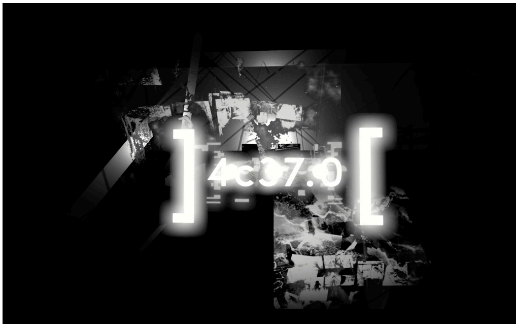
Bandeau projet [4c37.0]

Le philosophe français Henri Lefebvre est l'un des premiers à formuler le terme d' archi-texture . Il sert évidemment de base pour entreprendre une construction de l' archi-texture . Pour mettre en lumière cette élaboration, nous pouvons nous demander quelles différences il y a entre archi-textures et architextures ? Si les deux proviennent, naissent et réinventent la place de l'architecture et la pratique de l'espace , elles se différencient sur leurs modes d'action et leurs qualités propres. L' archi-texture semble se rapprocher d'une nouvelle forme du discours, là où l' architexture semble agir sur la narration même. En effet, l' archi-texture relocalise la figuration et la non-représentation d'un sens donné au récit (par le graphisme comme cité par Lefebvre) dans une mise en réseau là où l' architexture agit au travers d'une mise en réseau sur la constitution, et la fabrication d'une narration et du sens (attributeur) donné à cette dernière.