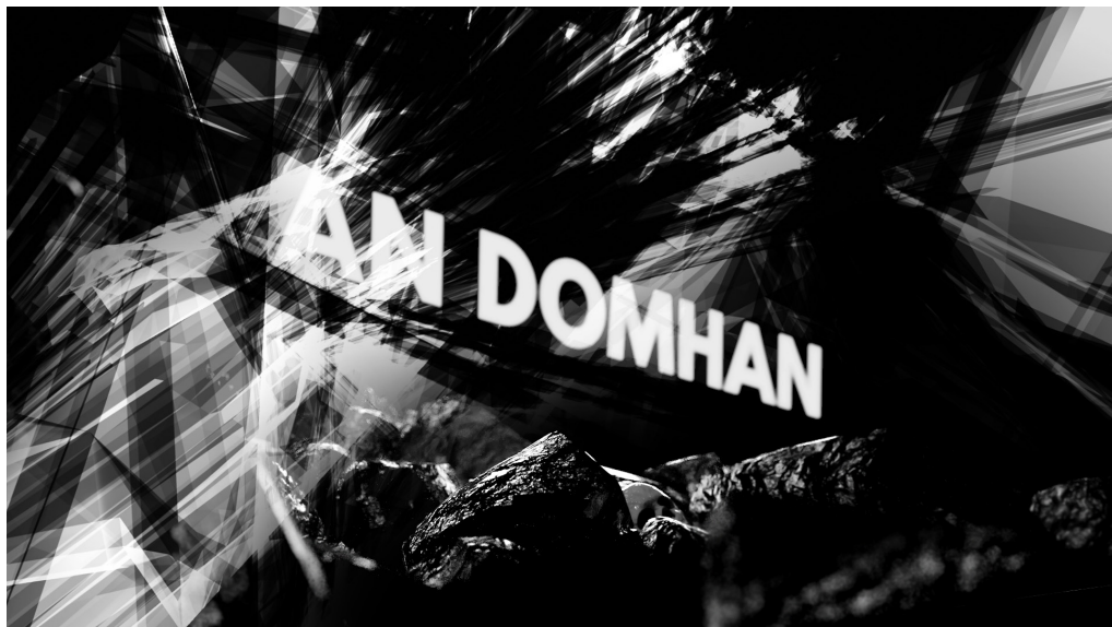
An Domhan, 2021

Claude Parent et Paul Virilio qui évoquent l'architecture sous « l'angle » du corps et une nouvelle expérience du lieu. C'est le noir des trous noirs, objets célestes passionnants et dont le mystère est devenu récemment image, document. C'est le noir de la matière, l'énergie, dans l'interférence et le corps. Le noir comme notion scientifique étend un champ du possible qui nous aide à comprendre sa poésie, sa nature. Cela densifie, rallonge un schéma en construction. À la manière de ceux de l'artiste Dan Graham en perpétuelle conception.