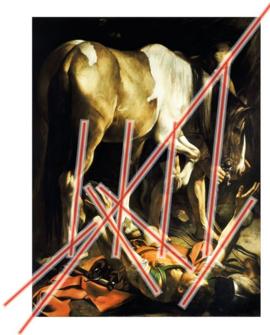
Michelangelo Merisi, dit Le Caravage, La Conversion de saint Paul , 1600 - 1604 Seconde version, Huile sur toile, 230 × 175 cm, Église Santa Maria del Popolo, Rome