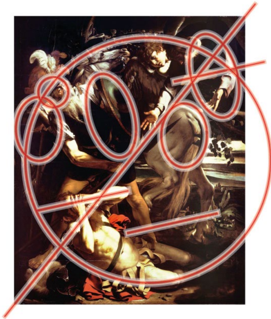
Michelangelo Merisi, dit Le Caravage, La Conversion de saint Paul , 1600 - 1604 Première version, huile sur bois de cyprès, 237 × 189 cm, Collection Balbi-Odescalchi, Rome

Personnage-Autre et architexture sont l'un pour l'autre de nouveaux attributs sculptés par l'arkhè. On en remarque leurs existences, leurs liens, leurs répétitions, leurs différents coups de sabot par coups de scalpels, c'est-à-dire notre exploration du Noir dans l'entre eSPACE . Chaque action crée, située dans ce Noir un nouvel attribut. Cet attribut densifie la relation du personnage-Autre et de l'architexture en conservant en lui toutes les informations donnant sens à cette relation. En effet, faire l'expérience en surface du Noir nous permet de percevoir quelque chose de ce dernier, mais ce que nous en percevons est sans épaisseur. Cependant nous nous plaçons alors dans la densité substantielle de la relation au personnage-Autre et l'architexture . Ce placement non intentionnel, produit par notre attention sur le Noir construit une structure jardinée, mobile, en évolution, métaphore sans fin de l'implicite de cette relation dans laquelle le REGARD® se dérobe. En effet ce dernier est immergé dans le Noir ; il a été recouvert de terre. Il agit sans commandement ; le Noir s'étend plus que lui. Si le REGARD® peut laisser sa marque dans le Noir, ce dernier s'affecte, mais reste origine 29 et commande de l'expérience. Car, même si la surface est au Noir, ce que l'on en fait y ®-TOURNE