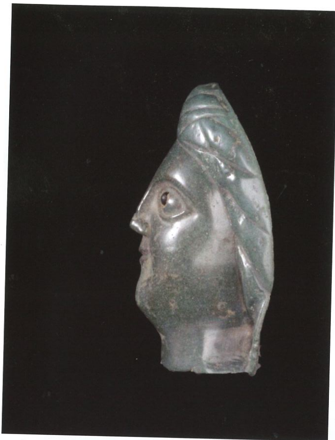
Figure 3 : Masque de Blicquy. Vue de profil. Photo : Romain Gilles © AWaP. Collection C.T.R.A., Centre d'Interprétation des Cultes et Croyances Antique Archéosite et Musée d'Aubechies Belœil asbl.

Lantier 1934, p. 52), de Bernouville et de la Forêt de Brotonne dans l'Eure (Leman-Delrive 2007, p. 124 et 125), de l'étoile dans la Somme (Leman-Delrive 2007, p. 125) qu'à la pièce antérieure d'une exceptionnelle tête masculine en argent découverte à Notre-Dame d'Alençon, dans le Maine-et-Loire et actuellement exposée au Louvre. Un traitement similaire du visage est également observable sur la statue bien connue de Bouray (Essonne) constituée d'un assemblage de tôles de cuivre jaune coulées et repoussées (Lantier 1934). On remarque que celle-ci possède des attributs typiquement gaulois (torque, position en tailleur) et pourrait vraisemblablement incarner le dieu Cernunos (pieds de cerf ?) à moins qu'il ne s'agisse de la représentation d'un guerrier héroïsé dans cette position caractéristique 33 .