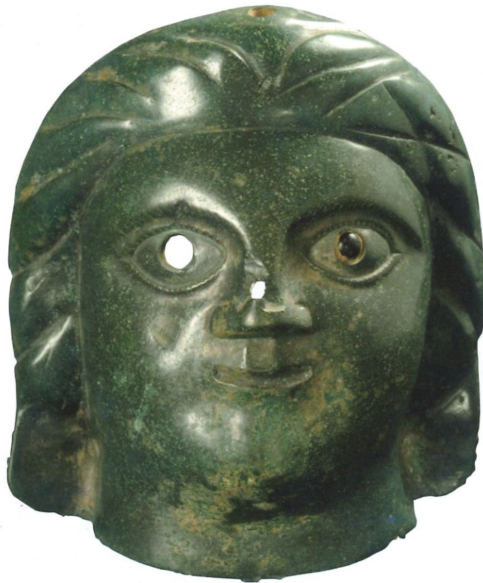
Figure 2 : Masque de Blicquy. Vue de face.

Une étude consacrée aux masques gallo-romains du nord de la Gaule réalisée par G. Leman-Delrive met en évidence la relative rareté de ce type d'objet sur le territoire du nord de la France (14 exemplaires) ainsi qu'en Belgique (3 exemplaires dont 2 à Blicquy 32 : Leman-Delrive 2007). Si la plupart de ces découvertes semblent se rattacher à un contexte cultuel (10 exemplaires), elles sont le plus souvent mal documentées (chronologie non précisée, contexte stratigraphique inconnu, découvertes fortuites ou anciennes...). En dehors des deux exemplaires de Blicquy, seuls deux masques mis au jour à Gennainville sont susceptibles d'illustrer un contexte cultuel suffisamment documenté d'un point de vue chronologique et stratigraphique (Mitard 1982-1). Parmi les quelques exemplaires de comparaison (Cf infra), le masque de Blicquy est le seul qui soit fondu à la cire perdue, les autres étant produit par déformation plastique et éventuel assemblage.