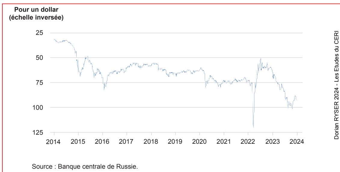
Figure 14 Cours du rouble, 2014-2024

D'autres mesures cherchent à restreindre les flux commerciaux de la Russie. Les premières sanctions introduites peu après le 24 février 2022 visaient à limiter les importations russes de produits de haute technologie qui peuvent avoir des applications militaires, comme les semi-conducteurs. En effet, ces composants électroniques sont nécessaires pour fabriquer la plupart des équipements militaires modernes, comme les missiles, les chars ou les avions de combat. Dans un deuxième temps, à partir de novembre 2022, les pays occidentaux ont mis en œuvre des mesures restreignant les exportations d'hydrocarbures russes afin de diminuer les ressources financières que la Russie peut allouer à la guerre. Ces sanctions incluent notamment un embargo européen sur les importations de pétrole russe et un plafonnement du prix du pétrole russe exporté avec le concours de sociétés occidentales (à hauteur de 60 dollars par baril). D'autres mesures, telles que les embargos américain, britannique et canadien sur les importations de pétrole russe, ont une portée plus symbolique : en effet, ces pays n'importaient que très peu de pétrole russe avant le début de la guerre en Ukraine.