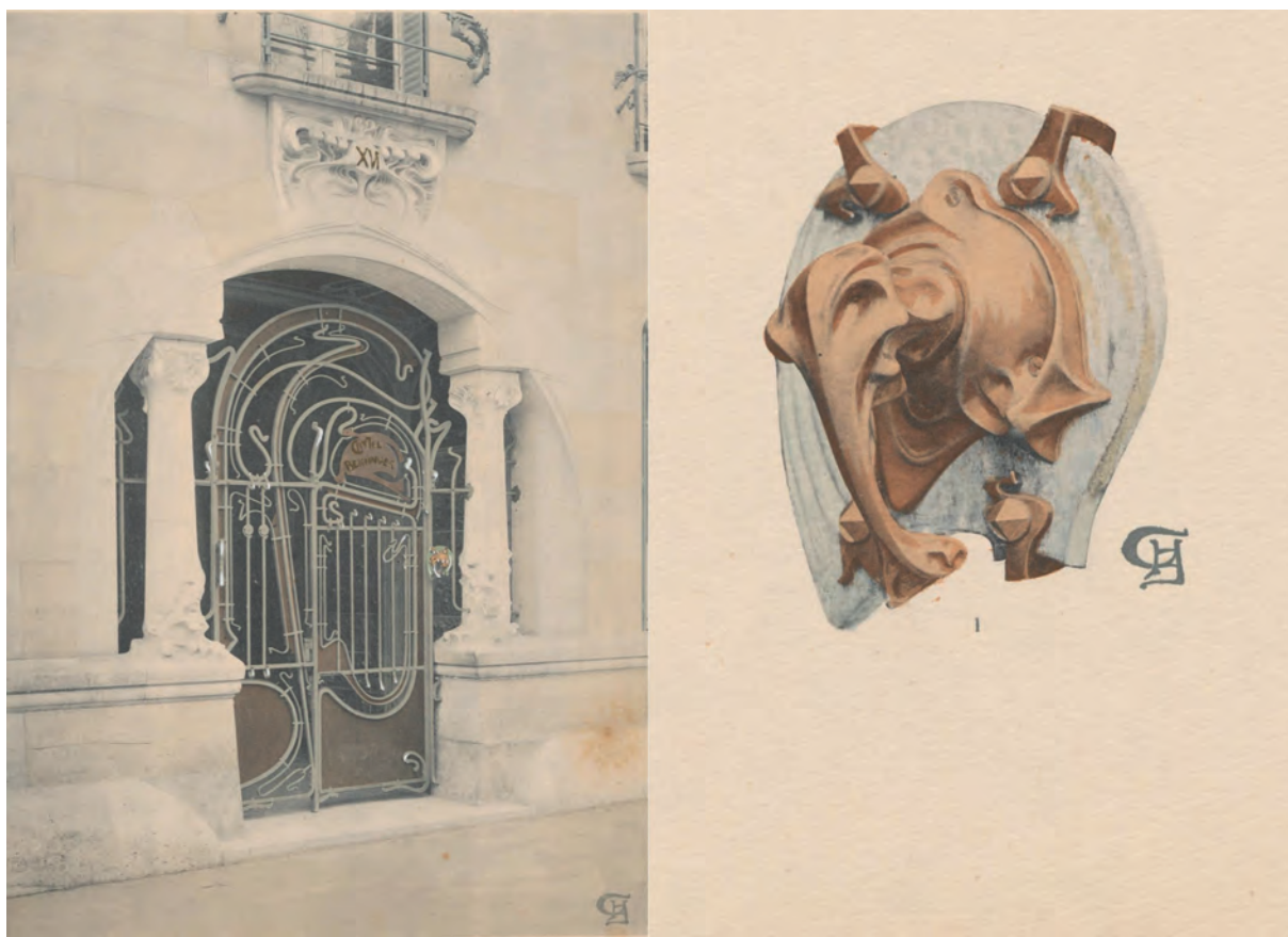
Fig. 4 : Hector Guimard, Portail d'entrée du castel Béranger avec à gauche la plaque du cabinet médical et à droite le coulisseau/sonnette permettant l'ouverture , planche 4 et 35, Rouam & Cie, 1898. Bibliothèque de Zurich.

était à son sommet. Rien d'étonnant donc à ce que cette fructueuse entente ait été célébrée en mai 1897 par le stand Gilardoni & Brault à l'Exposition de la céramique et des arts du feu qui présentait, non sans emphase, « un style moderne national 22 » à partir d'éléments dessinés par l'architecte.