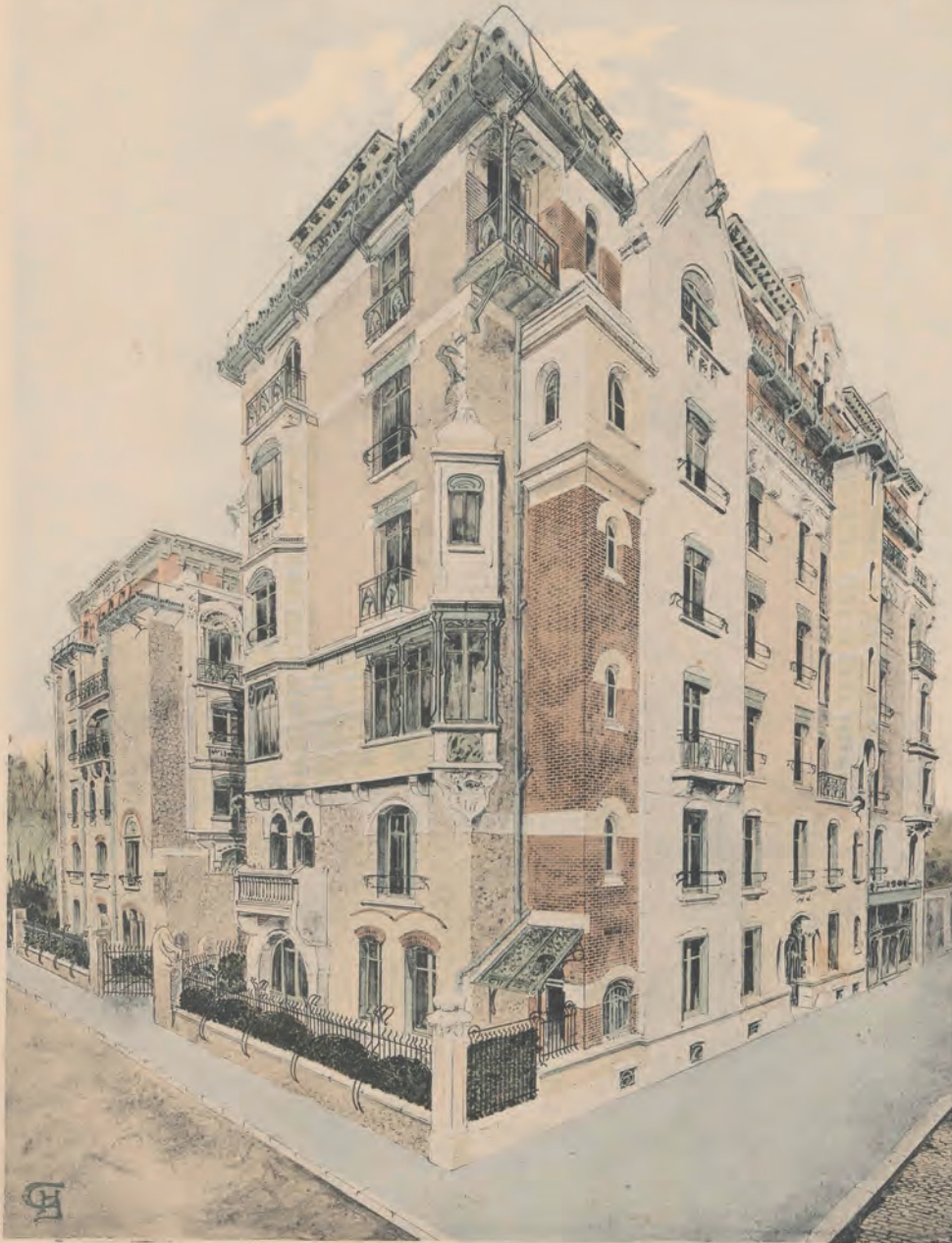
Fig. 1 : Hector Guimard, Façade du castel Béranger, planche 1, Paris, Rouam & Cie, bibliothèque de Zurich.