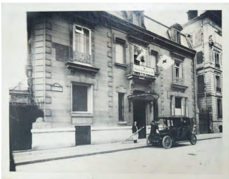
Fig. 2 : Anonyme, Hôtel Fournier, rue de la Tour, puis rue 18 Adolphe Yvon (XVI e arrondissement de Paris), photographie, première guerre mondiale. Fonds James H. Hyde papers, New York Historical society.