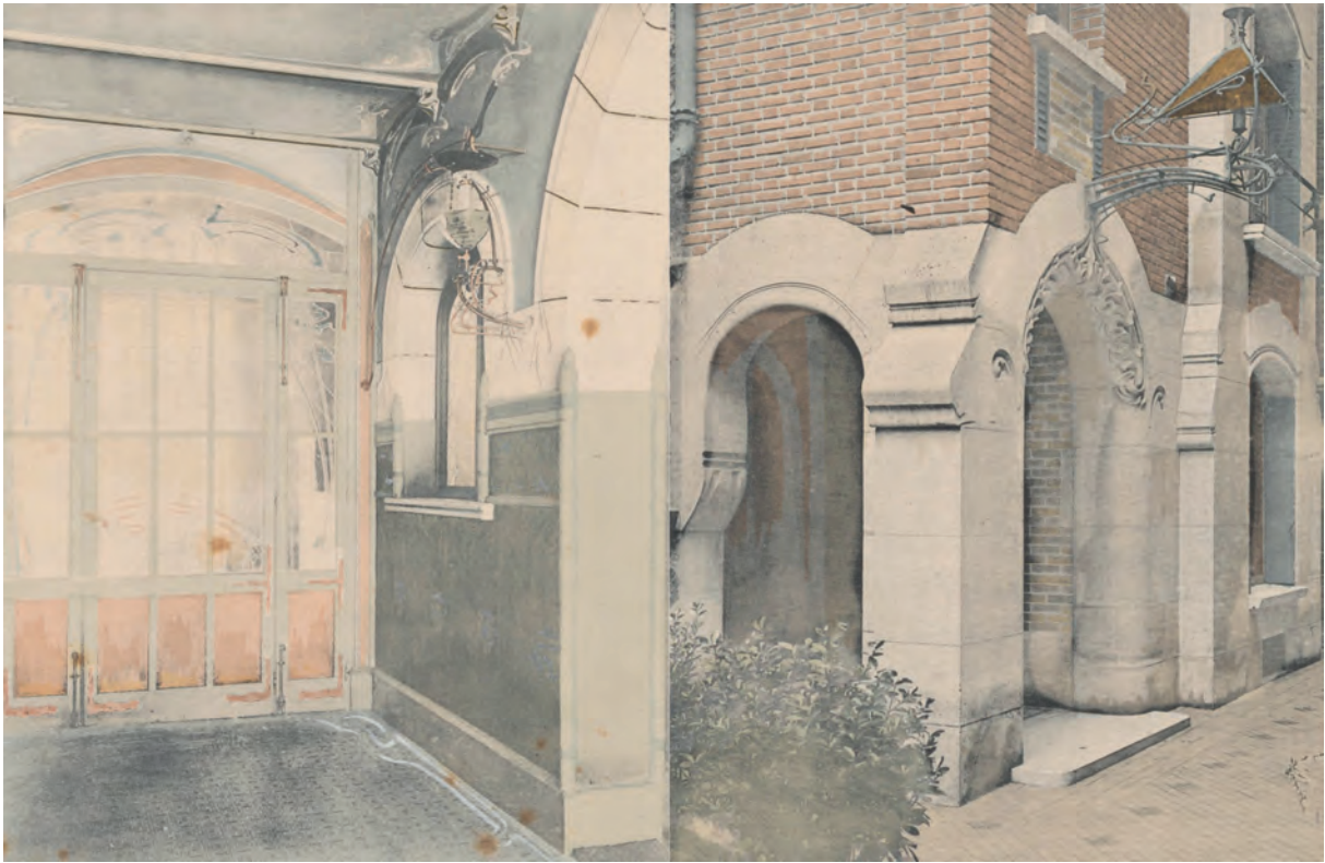
Fig. 5 : Vestibule du castel Béranger avec son décor de grés bouillonnant évoquant la formation de l'électricité à l'œuvre dans une pile de Lalande en forme d'obus.