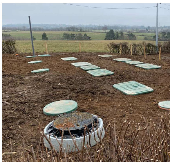
Figure 6. Vues du dispositif avant (gauche) et après (droite) mise sous terre

Le dimensionnement se réalise suivant deux critères de charges limites, dont le plus contraignant est retenu :