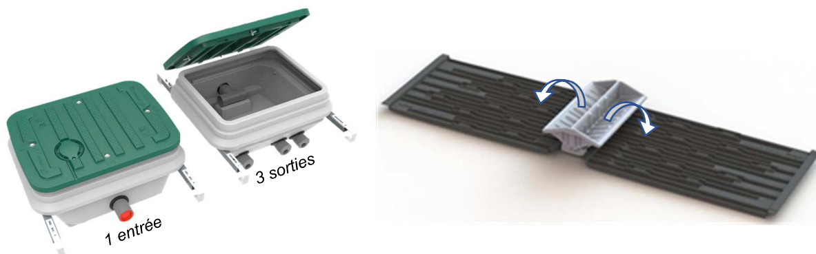
Figure 3. Vue du répartiteur version 3 voies (à gauche) et d'un auget bidirectionnel (à droite)

Le répartiteur peut être installé soit directement sur la cuve, soit sur un fond de fouille sur le sol pour les filières multiples, comme illustré en Figure 4. Pour les filières multiples avec répartiteur à surverse externe, chaque cuve conserve son répartiteur à surverse interne.