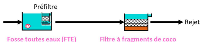
Figure 1. Synoptique de la filière (SATESE 07/26)

Le procédé « Filtre à fragments de coco » repose sur le principe de l'épuration par « cultures fixées sur support fin ». Cette filière est composée d'une fosse toutes eaux (FTE), suivie du filtre à base de fragments de coco. L'ensemble est enterré. Selon la taille de la station, plusieurs modules de filtres compacts à coco peuvent être installés en parallèle.