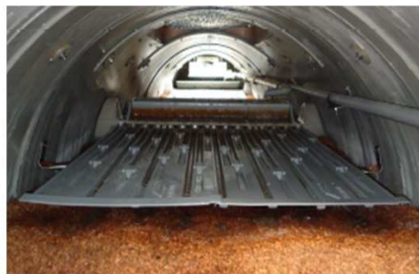
Figure 5. Augets et plaques de distribution perforées