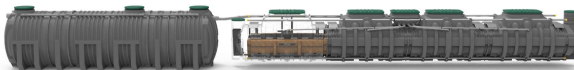
Figure 2. Vue du dispositif (source PTEE)