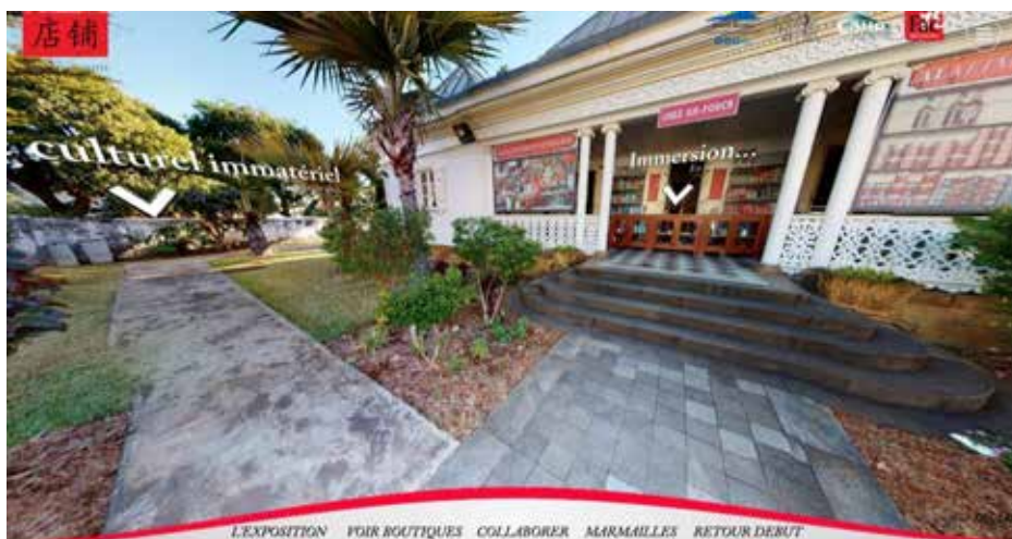
Figure 1. Exposition virtuelle Boutik Chinoise : https://storage.net-fs.com/hosting/7381827/0/

Dans ce sens, le projet Patrimindiocea questionne l'inclusion par l'écriture des patrimoines culturels grâce au numérique. La plateforme propose des parcours permettant de (re)contextualiser, dans une spatialité propre aux routes historiques étudiées (celles de l'Inde, de la soie, de l'esclavage et des mouvements sociaux contemporains), l'histoire de l'objet patrimonial identifié. Les visites virtuelles immersives proposent une dynamique participative d'inscription du patrimoine 10 par une logique de géolocalisation 11 et de témoignages, intégrant le point de vue des citoyens.